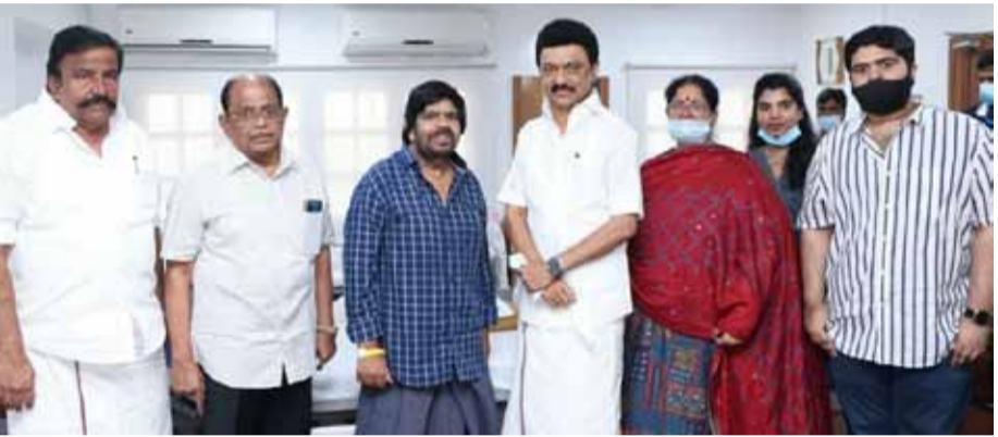
உடல்நலக் குறைவு காரணமாக சென்னை போரூர் இராமச்சந்திரா மருத்துவமனையில் அனுமதிக்கப்பட்டுள்ள நடிசரும், இயக்குனருமான டி.ராஜேந்தர் உடல்நலம் குறித்து முதல்வர் மு.க.ஸ்டாலின் நேரில் சென்று நலம் விசாரித்தார்.