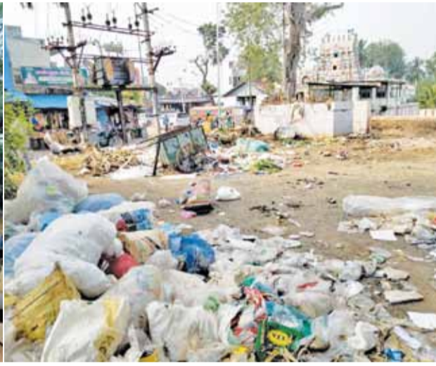
▶ புதுக்கோட்டை நகராட்சி துப்புரவு பணியாளர்கள் வேலை நிறுத்தத்தால் புதுக்கோட்டை நகர் முழுவதும் குப்பைகள் மலை போல் குவிந்து ஆங்காங்கே துர்நாற்றம் வீசுகிறது. புதுக்கோட்டை நகராட்சி கோவில் அருகில் மலை போல் குவிந்திருக்கும் குப்பைகள்.