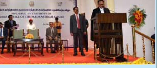
நீதிமன்ற கொலீஜியம் கடந்த ஏப்ரல் 19-ம் தேதி முன்பை உயர் நீதிமன்ற பொறுப்பு தலைமை நீதிபதியாக இருந்த எஸ்.வி.கங்காபூர்வாலாவை, சென்னை உயர் நீதிமன்றத்தின் தலைமை நீதிபதியாக நியமிக்க மத்திய அரசுக்கு, குடியரசுத் தலைவருக்கும் பரிந்துரை செய்தது. இந்த பரிந்துரையை ஏற்ற குடியரசு தலைவர், எஸ்.வி.கங்காபூர்வாலாவை தலைமை நீதிபதியாக நியமிக்க உத்தரவிட்டார். இதனைத் தொடர்ந்து, தலைமை நீதிபதியாக இன்று கிண்டியில் உள்ள ஆளுநர் மாளிகையில் எஸ்.வி.கங்காபூர்வாலா பதவி ஏற்றுக் கொண்டார். அவருக்கு தமிழக ஆளுநர் ஆர்.என்.ரவி பதவிப் பிரமாணம்