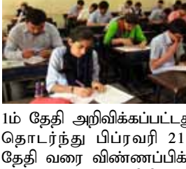
நிலை தேர்வு நேற்று மே 28 நடைபெறும் என்று யுபிஎஸ்சி அறிவித்திருந்தது. அதன்படி சீவில் சர்வீஸ் பணிக்கான முதல்நிலை தேர்வு இந்தியா முழுவதும் 73 நகரங்களில் நேற்று நடைபெற்றது. தமிழகத்தில் சென்னை, கோவை, மதுரை, திருச்சி, வேலூர் ஆகிய 5 நகரங்களில் நடந்தது. காலை 9.30 மணி முதல் காலை 11.30 மணி வரை பொது அறிவு தேர்வும், மதியம் 2.30 மணி முதல் மாலை 4.30 மணி வரை திற்ப்பு தேர்வும் நடந்தது. தேர்வு நடைபெறும் அனைத்து மையங்களிலும் பலத்த போலீஸ் பாதுகாப்பு வைக்கப்பட்டது.

சென்னை மே 29 ஐஎஸ், ஐபிஎஸ், ஐஆர்எஸ் உள்ளிட்ட சீவில் சர்வீஸ் பணிக்கான முதல்நிலை தேர்வு நேற்று நடைபெற்றது. இந்தியா முழுவதும் 7 லட்சம் பேர் இடஒதுக்கீடு எழுதிக்கொண்டனர். மத்திய அரசு பணியாளர் தேர்வாணையம் (யுபிஎஸ்சி) ஆண்டுதோறும் ஐஎஸ், ஐபிஎஸ், மற்றும் ஐஆர்எஸ் உள்ளிட்ட 21 வகையான பதவிகளுக்கான தேர்வுகளை நடத்தி வருகிறது. இந்த ஆண்டுக்கான சீவில் சர்வீஸ் பணியில் அடங்கிய 1,105 பதவிகளை நிரப்புவதற்கான அறிவிப்பை கந்த பிப்ரவரி 1ம் தேதி அறிவிக்கப்பட்டது. தொடர்ந்து பிப்ரவரி 21ம் தேதி வரை விண்ணப்பிக்க கால அவகாசம் விதித்தது. இத்தேர்வுக்கு இந்தியா முழுவதும் இருந்து சுமார் 7 லட்சம் பட்டதாரிகள் விண்ணப்பித்தனர். இதில், தமிழகத்தில் மட்டும் சுமார் 50 ஆயிரம் பேர் வரை தேர்வு எழுத அனுமதிக்கப்பட்டுள்ளனர். இவர்களுக்கு கட்டப்படும்