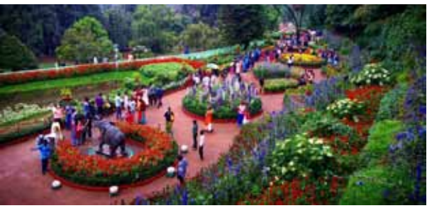
மே 30-ம் தேதி வரை கொடைக்கானல் மலர் கண்காட்சி நடைபெறும் என்று தோட்டக்கலைத்துறை அறிவித்துள்ளது.

திண்டுக்கல் மே 29 கொடைக்கானல் மலர் கண்காட்சிக்கு சுற்றுலா பயணிகள் வருகை அதிகரித்துள்ளதை அடுத்து மேலும் 2 நாட்கள் நீட்டிக்கப்பட்டுள்ளது. மலர் கண்காட்சி 3 நாட்கள் நடைபெறும் என்று அறிவிக்கப்பட்டிருந்த நிலையில் மேலும் 2 நாட்கள் நீட்டிக்கப்பட்டுள்ளது.