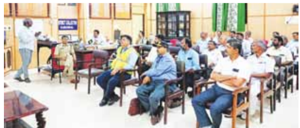
நடத்த திட்டமிடப்பட்டுள்ளது. நமது பேரிடர் துறையானது இது தொடர்பாக உள்ள அனைத்து அரசு துறைகள், தனியார் நிறுவனங்கள், ஆப்தமித்ர மற்றும் குடிமை பாதுகாப்பு படை உறுப்பினர்களை ஒருங்கிணைத்து இந்த ஒத்திகை நிகழ்ச்சியை செயல்படுத்த நடவடிக்கை மேற்கொண்டுள்ளது.