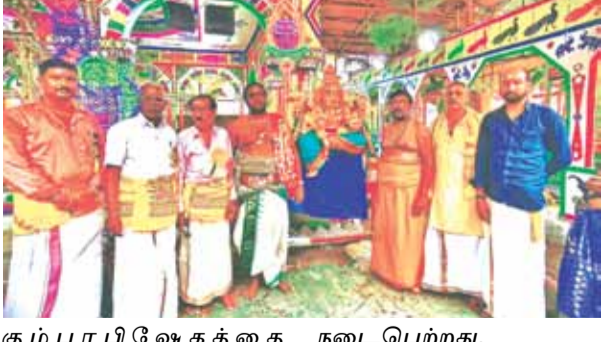
கும்பாபிஷேகத்தை தொடர்ந்து மகா அபிஷேகம், மகா தீபாராதனை, தீர்த்த பிரசாதம் வழங்கும் நிகழ்ச்சியும் அதனைத் தொடர்ந்து பகல் 12.00 மணி அளவில் சிறப்பு அன்னதானம் வழங்கும் நிகழ்ச்சியும்