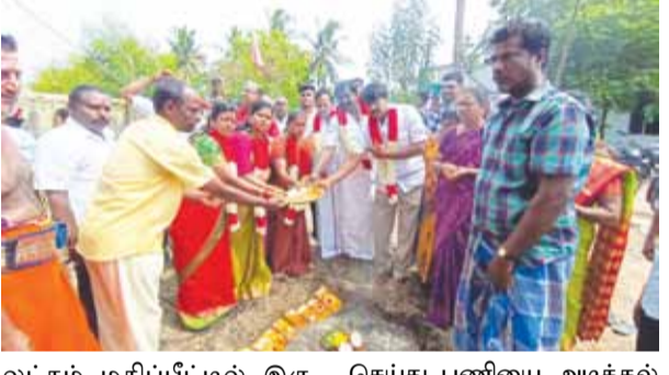
லட்சம் மதிப்பீட்டில் இரு வகுப்பறை என இரு பள்ளி கட்டிடங்களுக்கு 46.80 லட்சம் மதிப்பீட்டில் புதிய பள்ளி கட்டிடம் கட்டுவதற்கான அடிக்கல் நாட்டு விழா பள்ளி வளாகத்தில் நடைபெற்றது. இதில் மதுராந்தகம் அறிமுக சட்டமன்ற உறுப்பினர் மரகதம் குமரவேல் கலந்துகொண்டு புதிய பள்ளி கட்டிடம் கட்டுவதற்கான பூமி பூஜை

செங்கல்பட்டு, ஜூன் 28- செங்கல்பட்டு மாவட்டம் மதுராந்தகம் சட்டமன்ற தொகுதிக்கு உட்பட்ட பழமத்தூர், நெல்லி ஆகிய இரு கிராமங்களில் ஊராட்சி ஒன்றிய ஆரம்பப்பள்ளி செயல்பட்டு வருகிறது. இந்த ஆரம்ப பள்ளியில் போதிய வகுப்பறைகள் இல்லாமல் பள்ளி மாணவ மாணவிகள் படித்து வருவதாக பள்ளி தலைமை ஆசிரியர் மற்றும் பொதுமக்கள் மதுராந்தகம் சட்டமன்ற உறுப்பினர் மரகதம் குமரவேல் அவர்களிடம் கோரிக்கை மனு அளித்தனர். இந்த கோரிக்கை மனு அடிப்படையில் மதுராந்தகம் அறிமுக சட்டமன்ற உறுப்பினர் மரகதம் குமரவேல் சட்டமன்றத் தொகுதியில் இருந்து ஒரு பள்ளி க்கூடத்திற்கு 23.40