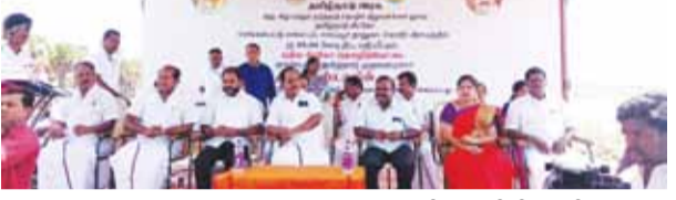
மூலம் நடைபெற்றது. இதனை செய்யூர் தாலுகா கொடூர் கிராமத்தில் உள்ள சி.கோ தொழில் பேட்டையை காஞ்சி நெடுஞ் மாவட்ட செயலாளர் க. சுந்தர் எம்எல்ஏ, செய்யூர் சட்டமன்ற உறுப்பினர் பணையர் பாபு ஆகியோர் தொடங்கி வைத்தனர்.

செய்யூர், ஜூன் 28- செய்கல்பட்டு மாவட்டம் செய்யூர் தாலுகா கொடூர் கிராமத்தில் தமிழ்நாடு அரசு குரு சிறு மற்றும் நடுத்தர தொழில் நிறுவனங்கள் துறை சார்பில் தமிழ்நாடு சி.கோ ரூபாய் 45.94 கோடி திட்ட மதிப்பீட்டில் புதிய தொழில்பேட்டை தொடக்க விழா நிகழ்ச்சி சென்னையில் தமிழ்நாடு முதல்மைச்சர் தலைமையிலும் குறு சிறு மற்றும் நடுத்தர தொழில் நிறுவனங்கள் துறை அமைச்சர் தாமு.அன்பரசன் முன்னிலையில் காணொளி