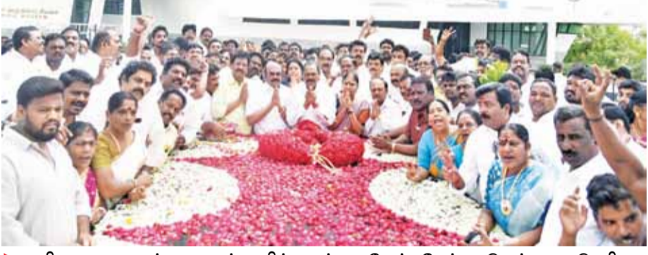
▶ அதிமுக அவைத்தலைவர் தமிழ்மகன் உசேன் நேற்று சென்னை மெரினா கடற்கரையில் அமைந்துள்ள அண்ணா, எம்ஜிஆர், ஜெயலலிதா ஆகியோரது நினைவிடத்துக்கு சென்று மலர் தூவி மரியாதை செலுத்தினார். இந்த நிகழ்வில் தலைமை கழக நிர்வாகிகள் மாவட்டச் செயலாளர்கள் பங்கேற்றனர்.