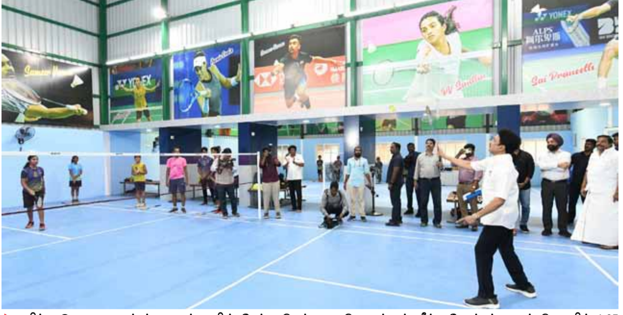
▶ தமிழ்நாடு முதலமைச்சர் மு.க.ஸ்டாலின் நேற்று சென்னை, கொளத்தூர், தீட்டி தோட்டம் முதல் தெருவில் 1.27 கோடி ரூபாய் செலவில் புனர்மைக்கப்பட்டு, நவீன வசதிகளுடன் கட்டப்பட்டுள்ள இறகு பந்து உள்விளையாட்டு அரங்குகளை திறந்து வைத்து விளையாடியுள்ளார்.

அறந்தாங்கி, நவ.24- புதுக்கோட்டை மாவட்ட அறந்தாங்கியில் உள்ள தனியார் திருமண மண்டபத்தில் சமூகநலன் மற்றும் மகளிர் உரிமை துறை, ஒருங்கிணைந்த குழந்தைகள் வளர்ச்சி பணிகள் திட்டம் சார்பில் சமுதாய வளைகாப்பு விழா நடந்தது.