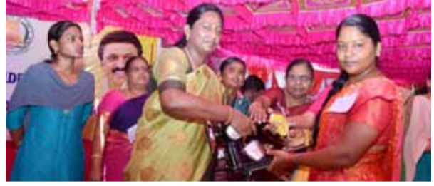
கள்ளக்குடி வட்டம், பேய்க்குளம் கிராமத்தில் நடைபெறும் மக்கள் தொடர்பு திட்ட முகாமில் மாவட்ட ஆட்சித் தலைவர் அவர்கள் பயணாளிகளுக்கு அரசு நலத்திட்ட உதவிகளை வழங்கினார்.

சென்னை, ஆக. 24. தீபாவளி பண்டிகையை முன்னிட்டு சென்னை தீவிரத்தில் பட்டாசு விற்பனை செய்ய தமிழக அரசு டென்ட் கோரியுள்ளது. நாடு முழுவதும் தீபாவளி பண்டிகை நடைபெறும் 15 நாட்களுக்கு பட்டாசு விற்பனை செய்ய அனுமதி வழங்கப்பட்டுள்ளது. மேலும், 55 கடைகள் அமைப்பதற்கான டென்ட்ரை கற்றுலா வளர்ச்சிக்கழகம் அறிவித்துள்ளது. சினைவில் டென்ட் இறுதி செய்யப்பட்டு கடைகள் அமைக்கும் பணி தொடங்கப்படும் என தமிழக அரசு அறிவித்துள்ளது.