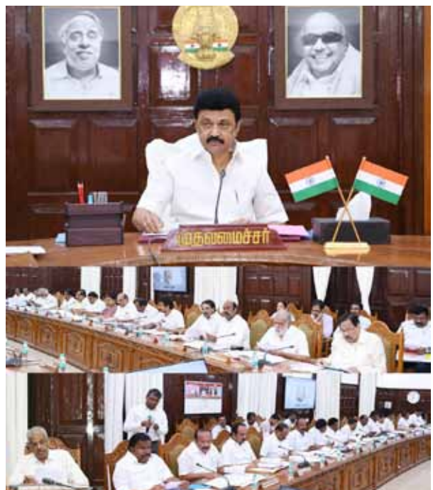
அளித்தால் 24 மணி நேரத்தில் முதல் தகவல் அறிக்கை பதிவு செய்ய வேண்டும். பொது மற்றும் தனியார் நிறுவனங்களில் பணியாற்றும் பெண்களுக்கு 50 சதவீதம் இடஒதுக்கீடு வழங்க வேண்டும். அரசியலுக்குவரவரும் பெண்களுக்கு 6 மாதகால

சென்னை, ஜன. 24- சென்னையில் முதல்வர் மு.க.ஸ்டாலின் தலைமையில் தமிழக அமைச்சரவைக் கூட்டம் நேற்று நடைபெற்றது. இக்கூட்டத்தில் தொழில் துறை, சமூகநலத் துறை மற்றும் கலால் துறை சார்பில் பல்வேறு முக்கிய முடிவுகள் எடுக்கப்பட்டன. குறிப்பாக, மாநில மகளிர் கொள்கைக்கு அமைச்சரவையில் ஒப்புதல் அளிக்கப்பட்டுள்ளது. தொழில் துறையின் சார்பில், பல்வேறு புதிய நியுவனங்களுக்கான அனுமதி கள் வழங்கப்பட்டன. ஏற்கனவே, உலக முதலீட்டு டிராள் கள் மாநாட்டில் ரூ.6 லட்சம் கோடிக்கு அதிகமான முதலீடுகள் ஈர்க்கப்பட்டன. சமூக நலத்துறையைப் பொறுத்தவரையில், ஏற்கனவே மாநில மகளிர் வரைவுக்கொள்கை வெளியிடப்பட்டிருந்தது. அதன் அடிப்படையில், நடந்த தமிழக அமைச்சரவைக் கூட்டத்தில், மாநில மகளிர் கொள்கைக்கு ஒப்புதல் அளிக்கப்பட்டுள்ளது. இந்த மாநில மகளிர் கொள்கை என்பது பெண்கள் புகார்