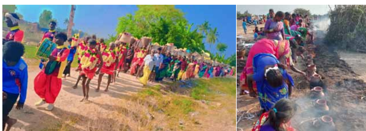
புதுக்கோட்டை மாவட்டம் அன்னவாசல் ஒன்றியம், விளத்துப்பட்டி ஊராட்சி, கட்டைக்கோண்டி கிராமத்தில் ஸ்ரீ கரந்தமலை சின்னையா ஆலயத்தில் 22ஆம் ஆண்டு பொங்கல் விழா கொண்டாடப்பட்டது. இதில் கட்டைக்கோண்டி கிராமத்தைச் சேர்ந்த அனைவரும் பொங்கல் வைத்து வழிபாடு செய்தனர். அதனைத் தொடர்ந்து சுற்றுமட்டார பகுதி மக்கள் அனைவருக்கும் அன்னதானம் வழங்கப்பட்டது.

பறித்தது. லக்கிம்பூரில் கோடி அமைச்சரின் மோடி விவசாயிகளை காரால் இடித்துக் கொன்றார். மத்தியப் பிரதேச மாநிலம் மண்டலூரில் பாஜக ஆட்சியில் நடந்த காவல்துறை துப்பாக்கிச் சூட்டில் விவசாயிகள் உயிரிழந்தார்கள். மேலும் பாஜகே போன்ற மோசமான வந்ததை காரால் அழைத்தார். 10 ஆண்டுகால பாஜக ஆட்சியில் விவசாயிகளுக்கு முதுகில் குச்சி, வயிற்றில் உதை நாள் மிஞ்சியது. மோடி அரசே இது அவமானம் என்று குறிப்பிட்டுள்ளார்.