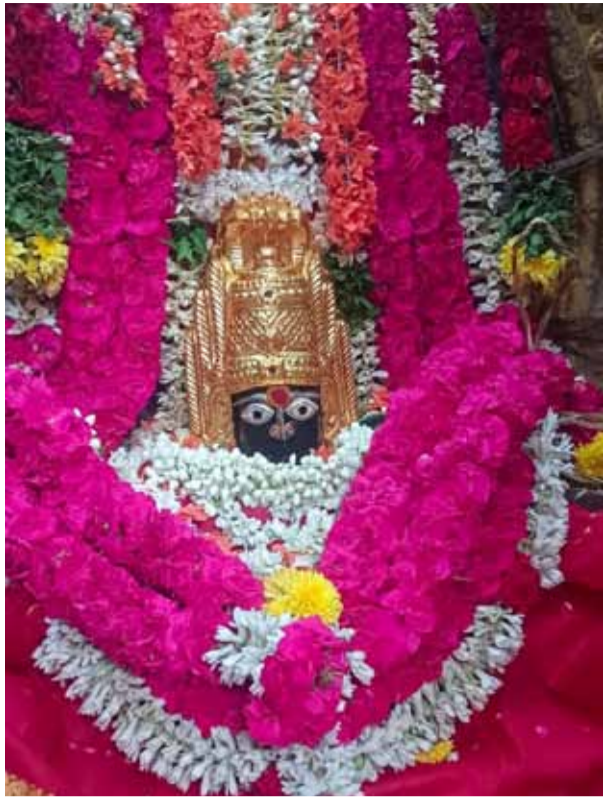
ஆடி முதல் வெள்ளியை முன்னிட்டு உத்திரமேரூர் நடுத்தெரு மாரியம்மனுக்கு சிறப்பு அலங்காரம் செய்யப்பட்டுள்ளது.