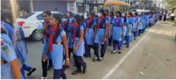
சாரணிய மாணவ, மாணவிகளின் பேரணி நடைபெற்றது. நகராட்சி மேல்நிலைப்பள்ளி வளாகத்தில் துவங்கிய பேரணி முக்கிய விதிகள் வழியே, மீண்டும் பள்ளியை வந்தடைந்தது.

மயிலாடுதுறை, மார்ச்.20- மயிலாடுதுறை மாவட்டம் மயிலாடுதுறையில் மாவட்ட அளவிலான சாரண, சாரணியர்களுக்கான 3 நாள் பயிற்சி முகாம் நகராட்சி மேல்நிலைப்பள்ளியில் துவங்கியது. இதில் மாவட்டம் முழுவதும் 60 பள்ளிகளில் இருந்து, 540 மாணவ, மாணவிகள் பங்கேற்றுள்ளனர். துவக்க நாளான நேற்று, உலக சமாதான வேண்டியும், சுற்றுச்சூழல் பாதுகாப்பை வலியுறுத்தியும், சாரண, மாணவிகளின் பேரணி நடைபெற்றது. நகராட்சி மேல்நிலைப்பள்ளி வளாகத்தில் துவங்கிய பேரணி முக்கிய விதிகள் வழியே, மீண்டும் பள்ளியை வந்தடைந்தது.