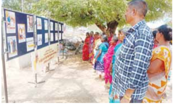
புதுக்கோட்டை மாவட்டம், அன்னவாசல் ஊராட்சி ஒன்றியம், ஆரியூர் கிராமத்தில் செய்தி மக்கள் தொடர்பு துறையின் சார்பில் தமிழ்நாடு முதலமைச்சரின் திட்டங்கள் மற்றும் சாதனைகள் குறித்த புகைப்படக் கண்காட்சி நேற்று நடைபெற்றது. இதனை ஏராளமான பொதுமக்கள் பார்வையிட்டனர்.