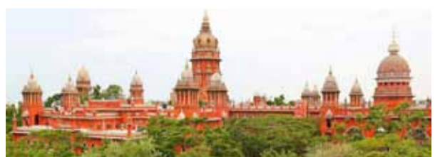
நிர்ணயம் செய்த அரசு, அந்த விலையை வசூலித்துக் கொண்டு, சங்கத்திற்கு பட்டுக்கோட்டை நகராட்சி, பத்திரப்பதிவும் செய்து கொடுக்கும்படி மட்டுக்கோட்டை நகராட்சிக்கு உத்தரவிட்டது. ஆனால், அந்தத் தொகையை வாங்க மறுத்த நகராட்சி, பத்திரப்பதிவும் செய்து கொடுக்காததால் 2013-ஆம் ஆண்டு சங்கத்தின் தரப்பில் சென்னை உயர் நீதிமன்றத்தில் வழக்கு தொடரப்பட்டது. இந்நிலையில், நகராட்சியை விரிவுபடுத்தி வளர்ச்சிப் பணிகள் மேற்கொள்வதாக கூறி, பாலிடெக்னிக் குக்கு ஒதுக்கப்பட்ட 20 ஏக்கர் நிலத்தை திரும்பப்பெறுவது தொடர்பாக நகராட்சியில் தீர்மானம் நிறைவேற்றப்பட்டது. எவ்வித இடையூறும் இல்லாமல் 30 ஆண்டுகளாக மூலமாக அளவிட்டு பாலிடெக்னிக் செயல்பட்டுக் கொண்டிருக்கிறது. எனவே,

சென்னை, பிப்.18- 30 ஆண்டுகளுக்கு முன்பு பாலிடெக்னிக் அமைக்க ஒதுக்கப்பட்ட நிலத்தை திரும்பப்பெறும் வகையில், மட்டுக்கோட்டை நகராட்சி நிறைவேற்றிய தீர்மானத்தை ரத்து செய்து சென்னை உயர் நீதிமன்றம் உத்தரவிட்டுள்ளது. தஞ்சாவூர் மாவட்டம், மட்டுக்கோட்டை மற்றும் சாத்தான்காடு பகுதிகளில் குடிநீர் வசதி ஏற்படுத்துவதற்காக 1964-ல், 37.93 ஏக்கர் நிலத்தை தமிழக அரசு கையகப்படுத்தியது. இந்நிலையில், 1982ஆம் ஆண்டு பாலிடெக்னிக் அமைக்க, அதே பகுதியில் 20 ஏக்கர் நிலத்தை ஒதுக்கித் தரக் கோரி மட்டுக்கோட்டை பாலிடெக்னிக் சங்கம் அரசிடம் விண்ணப்பித்தது. இதனை பரிசீலித்த அரசு, குடிநீர் திட்டத்திற்காக கையகப்படுத்திய நிலத்தில் 20 ஏக்கரை சங்கத்திற்கு ஒதுக்கி 1983-ஆம் ஆண்டு மட்டுக்கோட்டை நகராட்சி உத்தரவிட்டது. இதில் பாலிடெக்னிக், உணவு விடுதி ஆகியவை கட்டப்பட்ட நிலையில், அந்த நிலத்திற்கு ஒரு கோடியே ஒரு லட்சத்து 70 ஆயிரத்து 58 ரூபாய் விலை