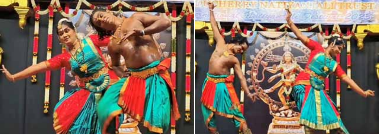
▶ மஹா சிவராத்திரி விழாவையொட்டி புதுச்சேரி ஸ்ரீ சித்தானந்தர் கோயிலில் நடைபெற்ற நாட்டியாஞ்சலி நிகழ்வில் கலைஞர்களின் அபிநயங்களின் சில துளிகள்.