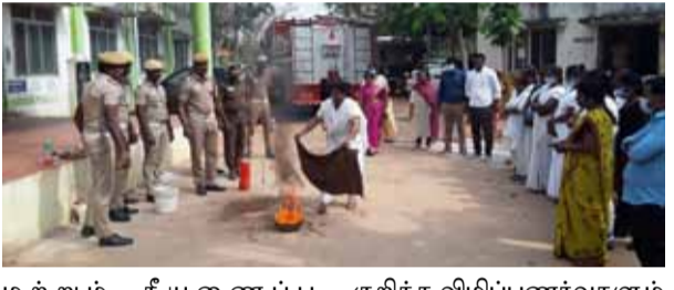
முற்று தீயணைப்பு முறைகள் குறித்த விழிப்புணர்வு ஒத்திகை நடைபெற்றது. இதில் தீயை பராமல் எப்படி அணைப்பது, தீப்பற்றி எரிந்தால் எடுக்க வேண்டிய முன்னெச்சரிக்கைகள் குறித்த விழிப்புணர்வுகளும் தீபாதித்தவர்களை எவ்வாறு காப்பாற்ற வேண்டும் என்பது உள்ளிட்ட பல வேறு தீ தடுப்பு முன்னெச்சரிக்கைகள் குறித்து கந்தர்வகோட்டை தீயணைப்புத் துறையினர்

கந்தர்வகோட்டை பிப்.18- புதுக்கோட்டை மாவட்டம், கந்தர்வகோட்டை அருகில் உள்ள புதுநகர் ஆரம்ப சுகாதார நிலையம் மற்றும் கல்லாக்கோட்டை ஊராட்சியிலும் பேரிடர் மேலாண்மை ஒத்திகை மற்றும் தீ தடுப்பு தீயணைப்புத் துறையினர் சார்பில் நடைபெற்றது. புதுக்கோட்டை மாவட்டம், கந்தர்வகோட்டை அருகே உள்ள புதுநகர் ஆரம்ப சுகாதார நிலையத்திலும் கல்லாக்கோட்டை ஊராட்சியிலும் தீ தடுப்பு முறைகள் குறித்த விழிப்புணர்வு ஒத்திகை நடைபெற்றது. இதில் தீயை பராமல் எப்படி அணைப்பது, தீப்பற்றி எரிந்தால் எடுக்க வேண்டிய முன்னெச்சரிக்கைகள்