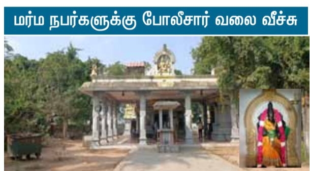
மர்ம நபர்களுக்கு போலீசார் வலை வீச்சு

ஊத்துக்கோட்டை, பிப். 18 - திருவள்ளூர் மாவட்டம், எல்லாபுரம் ஒன்றியம், தண்டலம் கிராமத்தில் அருள்மிகு ஸ்ரீ காமாட்சி அம்பாளர் சமேத ஸ்ரீ தரணீஸ்வரர் திருக்கோவில், மற்றும் பொன்னியம்மன் திருக்கோவில் ஆகியவை உள்ளது. இக்கோவில்களுக்கு அருகே குமரிடிப்புண்டி ஒன்றியம், முக்கரம்பாக்கம் ஊராட்சிமையே சேர்ந்த மாம்பேடு கிராமத்தில் ஸ்ரீ வேணுகோபால் சுவாமி திருக்கோவில் ஒன்று உள்ளது.