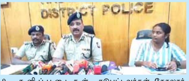
9 தனிப்படைகள் அமைக்கப்பட்டு தீவிர விசாரணை நடத்தப்பட்டு வருகிறது. இந்த நிலையில் திருவண்ணாமலை மாவட்ட போலீஸ் குப்பிரண்டு அலுவலர்களின் வடக்கு மண்டல ஐ.ஜி. கண்ணன் திருவண்காமலை காவல்துறை-கந்தர்வகோட்டை திருவண்ணாமலை மாவட்ட போலீஸ் குப்பிரண்டு தரப்பில் சென்ற 6 பேரை குஜராத் திருத்தி நிறுத்தி அவர்களை பிடித்து விசாரணை நடத்தி வருகிறோம். அது மட்டுமன்றி போலீஸ் நெருங்கியதை அறிந்து கோலார் பகுதியில் இருந்து பெங்களூர் வந்து அங்கிருந்து விமானத்தின் மூலம் அரியானாவிற்கு தப்பி சென்ற 2 பேரை அரியானாவில் பிடித்து விசாரணை நடத்தப்பட்டு வருகிறது. விசாரணை இன்னும் நிறைவு பெறவில்லை. ஆனால் குற்றவாளிகள் அரியானாவில் இருந்து

திமலை பிப்.18- திருவண்ணாமலையில் 4 ஏ.டி.எம். மையங்களில் கொள்ளையடித்துவிட்டு விமானத்தில் தப்பிச் சென்ற கொள்ளையர்கள் அரியானாவில் சிக்கினர். பிடிபட்ட 10 பேரிடம் தனிப்படை யினர் தீவிர விசாரணை நடத்தி வருகின்றனர். திருவண்ணாமலை மாவட்டத்தில் கடந்த 12-நேதி அதிகாரலையில் திருவண்ணாமலை நகரில் தேனிமலை மற்றும் கோவில் தெருவில் உள்ள டீல்டீ பாங்க் ஆப் இந்தியா வங்கியின் ஏ.டி.எம். மையங்களில் ரெயில் நிலையம் சாலையில் உள்ள ஏ.டி.எம். வங்கியின் ஏ.டி.எம். மையத்திலும் கலசபாக்கத்தில் உள்ள ஒன் இண்டியா வங்கியின் ஏ.டி.எம். மையத்திலும் மர்ம நபர்கள் கொள்ளை சம்பவத்தில் ஈடுபட்டனர். அப்போது அவர்கள் ஏ.டி.எம். மையங்களில் இருந்த பணம் எடுக்கும் எந்திரங்களை வெட்டி எந்திரத்தின் மூலம் வெட்டி அதிலிருந்து ரூ.72 லட்சத்து 78 ஆயிரத்து 600-ஐ கொள்ளையடித்து சென்றனர். இதுகுறித்து வடக்கு மண்டல ஐ.ஜி. கண்ணன் மேற்பார்வையில் உள்ளது உறுதியாகியுள்ளது. கொள்ளை சம்பவத்தில்