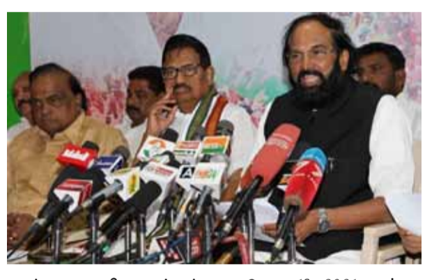
அன்றைய பிரதமர்கள் நரசிம்ம ராவ் மற்றும் அடல் பிஹாரி வாஜ்பாய் ஆகிய இருவரும் கோடிக்கணக்கான இந்திய முதலீட்டாளர்களைப் பார்த்து ஊழல்களை விசாரிக்கும் தீவிர தீர்ப்புக் குழு தீர்மானம் எடுத்தது. அதானி குழுமத்தில் எல்ஜிசி வைத்திருக்கும் பங்குகளின் மதிப்பு 30 டிசம்பர் 2022 அன்று ரூ.83,000 கோடியிலிருந்து ரூ. 39,000 கோடியாகக் குறைந்தது.

சென்னை, பிப்.18- "மோடி பிரதமராக பதவியேற்ற 2014-ஆம் ஆண்டில் உலக கோடைவளர்ச்சி வரிசையில் 609-வது இடத்தில் இருந்த கவுதம் அதானி, 2022-ல் இரண்டாவது இடத்திற்கு வந்த அதிசயத்தை நாட்டு மக்கள் பார்த்துக் கொண்டிருக்கிறார்கள். இத்தகைய அசுர வளர்ச்சிக்கு பிரதமர் மோடியின் ஆதரவுதான் காரணம் என்பதை எவராவது மறுக்க முடியுமா?" என்று தெலங்காணா மாநில காங்கிரஸ் கமிட்டி முன்னாள் தலைவர் உத்தம் குமார் ரெட்டி கேள்வி எழுப்பியுள்ளார்.