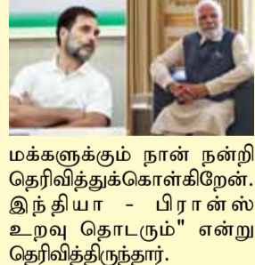
மக்களுக்கும் நான் நன்றி தெரிவித்துக்கொள்கிறேன். இந்தியா - பிரான்ஸ் உறவு தொடரும்" என்று தெரிவித்திருந்தார்.

அந்நாட்டிற்குச் சென்றார். அங்கு பிரதமர் மோடிக்கு, பிரான்ஸ் அதிபர் இரமான் டெல்கோ, தங்கள் நாட்டின் உயரிய விருதான கிரான்ட் கிரான் ஆஃப் தி லீஜியன் ஓஃப் ஹானர் விருதை வழங்கி கவுரவித்தார். வெள்ளிக்கிழமை அந்நாட்டின் தேசிய தின கொண்டாட்டத்தில் மோடி சிறப்பு விருந்தினராகப் பங்கேற்றார்.