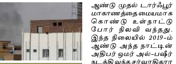
இந்தியர்களுக்கு எச்சரிக்கை இதற்கிடையே, சூடானில் உள்ள இந்திய துணை துரை அங்கு வசிக்கும் இந்தியர்களுக்கு எச்சரிக்கை விடுத்துள்ளது. அதன்படி, சூடானில் துப்பாக்கிச் சூறும், கலவரம் நடப்பதால் அங்கிருக்கும் இந்தியர்கள் அனைவரும் பாதுகாப்பாக விட்டாலேயே இருக்குமாறு அறிவுறுத்தப்படுகிறார்கள். வீட்டை விட்டு யாருமே வெளியே செல்ல வேண்டாம் என்று உடனடியாக அறிவுறுத்தப்படுகிறார்கள். அமைதியாக இருங்கள். அடுத்த தகவலுக்கு காத்திருங்கள் என்று தெரிவித்துள்ளது.

ஆண்டு முதல் டார்ஃபூர் மாகாணத்தை மையமாக கொண்டு உள்நாட்டு போர் நிலவிவருகிறது. இந்த நிலையில் 2019-ம் ஆண்டு அந்த நாட்டின் அதிபர் ஓமர் அல்-பஷீர் நடத்திவந்த சர்வாதிகார ஆட்சி மக்கள் போராட்டத்தால் அகற்றப்பட்டது. இதன்பின் புதிய அரசை அமைப்பதற்கான ஜனநாயக ரீதியான நடவடிக்கைகளை எடுக்கப்பட்டு வந்தது. இந்த நிலையில், ராணுவம் நாட்டைக் கைப்பற்றியது. இதனால் சூடான் ராணுவத்துக்கு எதிராக மக்கள் புரட்சி வெடித்தது. இதில் இதுவரை ஆயிரக்கணக்கானோர் கொல்லப்பட்டுள்ளதாக கூறப்படுகிறது. பரவலாகிவருகிறது. எடுத்து வருவதாக தெரிவித்துள்ளது. வடகிழக்கு ஆப்பிரிக்கா நாடான சூடானில் கடந்த 2003-ம்