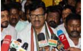
வருடமாக வாடகை கட்டவில்லை என்று நோட்டீஸ் பெறுகிற நிலையில் இருக்கிறேன். நான்கு ஆடுகளை மட்டுமே வைத்திருந்ததாக கூறிய அவர்கள் உதவியும், வீட்டு வாடகை அனைத்தையும் மற்றவர்கள் தான் கொடுக்கிறார்கள். நான் கட்டியிருக்கும் ரபேல் வாட்ச் 'பெல் அண்ட் ரோஸ்' என்ற நிறுவனம், ரபேல் பிமானத்தை தயாரித்த பிரெஞ்சு நிறுவனத்துடன் சேர்த்து தயாரித்தது. உலகில் மொத்தமே 500 ரபேல் வாட்ச்-கள்தான் உள்ளன. நான் கட்டியிருப்பது 147-வது வாட்ச். இந்தியாவில் 2 ரபேல் வாட்ச்-கள் மட்டும்தான் விற்றுள்ளன. இதில் ஒன்றை மும்பையைச் சேர்ந்த ஒருவர் வைத்துள்ளார்" என்றும் கூறியிருந்தார்.

சென்னை, ஏப்.16- "பாஜக தலைவர் அண்ணாமலை மாதம் ஒன்றுக்கு மூன்றே முக்கால் லட்சம் வீட்டு வாடகை எப்படி கொடுக்க முடிகிறது? மூன்று லட்ச ரூபாய் கை கடிக்காரமும் எப்படி அணிய முடிகிறது? இதற்கு யார் பணம் கொடுக்கிறார்கள்? இது குறித்து உரிய விசாரணை நடத்தப்பட வேண்டும்" என்று தமிழ்நாடு காங்கிரஸ் கமிட்டியின் தலைவர் கே.எஸ்.அழகிரி கூறியுள்ளார். இது தொடர்பாக அவர் தனது டிவிடீபேர்ட்டில் வெளியிட்டுள்ள பதிவில், "50 ஆண்டுகால பொது வாழ்க்கையில் இருமுறை சட்டமன்ற உறுப்பினராக, ஒருமுறை மக்களவை உறுப்பினராக இருந்து தமிழ்நாடு காங்கிரஸ் கமிட்டி தலைவராக இருக்கும் நான், நடந்தனத்தில் உள்ள தமிழ்நாடு அரசு அடுக்குமாடி குடியிருப்பில் ரூபாய் 16,000 வாடகைக்கு குடியிருக்கிறேன். ஒரு www.enmannemakkal.com என்ற இணையதளத்தில் அண்ணாமலை நேற்று வெளியிட்டார். அப்போது பேசிய அவர், மாநிலத் தலைவராக எனக்கு மாதத்துக்கு ரூ.8 லட்சம் செலவாகிறது. நண்பர்கள், கட்சியின் உதவியால் தான் இவற்றைச் சமாளிக்க முடிகிறது. காங்கிரசு, உதவியாளர்கள் உதவியும், வீட்டு வாடகை அனைத்தையும் மற்றவர்கள் தான் கொடுக்கிறார்கள். நான் கட்டியிருக்கும் ரபேல் வாட்ச் 'பெல் அண்ட் ரோஸ்' என்ற நிறுவனம், ரபேல் பிமானத்தை தயாரித்த பிரெஞ்சு நிறுவனத்துடன் சேர்த்து தயாரித்தது. உலகில் மொத்தமே 500 ரபேல் வாட்ச்-கள்தான் உள்ளன. நான் கட்டியிருப்பது 147-வது வாட்ச். இந்தியாவில் 2 ரபேல் வாட்ச்-கள் மட்டும்தான் விற்றுள்ளன. இதில் ஒன்றை மும்பையைச் சேர்ந்த ஒருவர் வைத்துள்ளார்" என்றும் கூறியிருந்தார்.