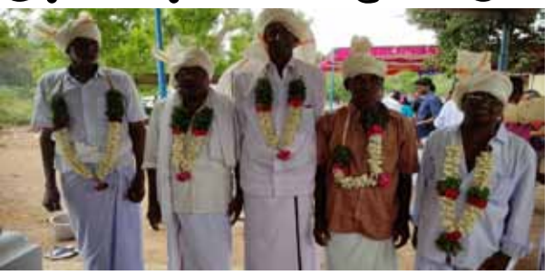
நட்டு, கோயிலை சுத்தம் செய்து, புரணமைத்து, வர்ணம் தீட்டி, மாவிளக்கு போட்டு, மொட்டைஅடித்து, கூடிக்குழுமி ஒவ்வொருவரும் தங்களை அறிமுகம் செய்து கொண்டு கறிவிருந்து செய்து ஒன்று கூடி மூதாதையர்கள் நினைவுகளை பகிர்ந்து

நெடுவாசலில் பொண்ணா குடும்ப உறவுகள் முதாதையர் வழிபாடு ஆலங்குடி, ஏப்.16- புதுக்கோட்டை மாவட்டம், ஆலங்குடி தாலுகா, நெடுவாசல் கீழ்பாதி கிராமத்தில் சுமார் 100க்கும் மேற்பட்ட "பொண்ணா குடும்ப உறவுகள்" தங்களை மூதாதையர்களை நினைவு கூர்ந்து வணங்கி கூட்டுக் குலதெய்வ வழிபாட்டை நெடுவாசல் கிராமத்தின் காவல் தெய்வமான அய்யனார் கோவில்லில் ஒன்று கூடி புதுமையாக சிறப்பாக கொண்டாடினர். இந்நிகழ்வில் நூற்றுக்கணக்கான மரக்கன்றுகளை நெடுவாசல் கிராமத்தின் காவல் தெய்வமான அய்யனார் கோவில்லில் ஒன்று கூடி புதுமையாக சிறப்பாக கொண்டாடினர்.