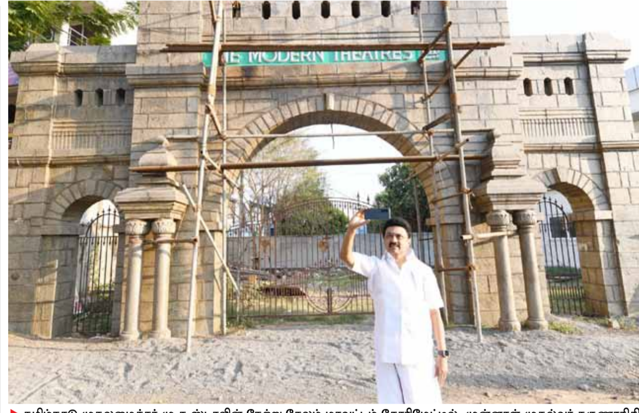
தமிழ்நாடு முதலமைச்சர் மு.க.ஸ்டாலின் நேற்று செலம் மாவட்டம் கோரிமேட்டில், முன்னாள் முதல்வர் கருணாநிதி பணியாற்றிய பழம்பெருமை வாழ்ந்த மாடர்ன் தியேட்டர்ஸ் படப்பிடிப்பு நிறுவனத்தின் புதுப்பிக்கப்பட்டு வரும் நுழைவாயிலில் செல்பி புகைப்படம் எடுத்துக் கொண்டார்.