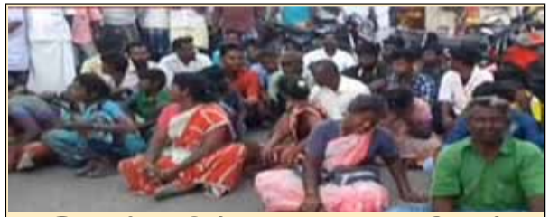
இலுப்பூரில் சாலை மறியல்

புதுக்கோட்டை மாவட்டம் விராலிமலையை அடுத்த பிலிப்பீட்டி ஊராட்சி ஒன்றிய நடுநிலைப்பள்ளியைச் சேர்ந்த மாணவிகள் 15 பேர் திருச்சி மாவட்டம் ஏழூர்பட்டியில் உள்ள தனியார் பொறியியல் கல்லூரியில் நடைபெறும் குடியரசு தின விளையாட்டுப் போட்டிகளில் பங்கேற்பதாக நேற்று உடற்கல்வி ஆசிரியருடன் வந்துள்ளனர்.