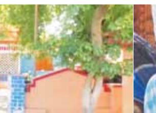
கே.புதுப்பட்டி போலீசார் வழக்குப் பதிவு செய்து