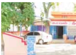
சடலமாக கிடந்துள்ளது. இந்த சம்பவம் குறித்து

சேர்ந்து வாழ்ந்து வந்துள்ளார். இந்நிலையில் அவர்களுக்கு கடந்த 37 நாட்களுக்கு முன்பு ஆண் குழந்தை பிறந்துள்ளது. இந்நிலையில், வெள்ளிக்கிழமை (12ஆம் தேதி) மாலை அவர்களது வீட்டு மாடியில் உள்ள சின்டெக்ஸ்டேக்கில் கழுத்தில் காயங்களுடன் குழந்தை