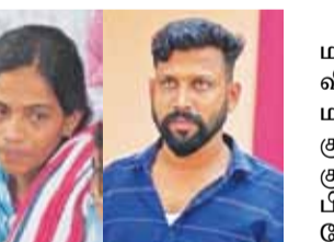
விசாரணை மேற்கொண்டு வந்தனர்.