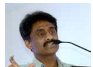
அவர் இந்த மாநில தலைமைத் தகவல் ஆணையராக பதவியில் பதவியில் 3 ஆண்டுகள் அல்லது 65 வயதை எட்டிவரை இருப்பார். இதில் எது குறைவான காலமாக அது அவரது ஓய்வுக்கான காலமாகக் கருதப்படும். தகவல் அறியும் உரிமைச் சட்டத்தின் அடிப்படையில், தமிழக அரசின் சார்பில் கடந்த 2005-ஆம் ஆண்டு