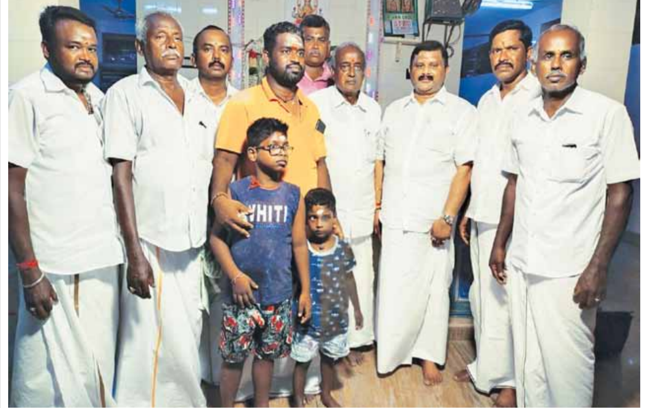
புதுக்கோட்டை மாவட்டம், திருமயம் தாலுகா, குலமங்கலம் அடுத்த கொப்பரம்பட்டி கிராமத்தில் 100 ஆண்டுகளாக அருள்பாளித்துக் கொண்டிருக்கும் ஸ்ரீ பத்தினிநாச்சி அம்மன் திருக்கோவில் கும்பாபிஷேகம் இன்று நடைபெற உள்ளது. விழாவிற்கான ஏற்பாடுகளை 56 ஊர் யாதவ சமூகம் திருப்பணிக்குழுவினர் செய்துள்ளனர்.

கர்நாடக தேர்தலில் ஆளும் பாஜக 224, எதிர்க்கட்சியான காங்கிரஸ் 223 (ஒரு தொகுதி விவசாய சங்கம்), மதச்சார்பற்ற ஜனதா தளம் 207, ஆம் ஆத்மி 217, பகுஜன் சமாஜ் 133 தொகுதிகளில் போட்டியிட்டன. 918 சுயேச்சைகள் உட்பட மொத்தம் 2,613 வேட்பாளர்கள் போட்டியிட்டனர் என்பது குறிப்பிடத்தக்கது.