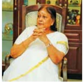
ராஜமாதா தொண்டைமான் சகோதரர் நமணத் தொண்டைமான் 1960ல் தஞ்சை மன்னர் இவருக்கு இராம மடம் என்னும் வைர மாலையையும், பெரிய இராமபாணம் என்று கூறப்படும் வில் அம்பையும் பரிசாக அளித்தார். பின்னர் இவர் தன்னுடைய சகோதரி கதலி ஆயிரை இராமநாதபுர மன்னன் கீழவன் சேதுபதிக்கு மணம் முடித்து 1686ல் தன்னுடைய ராஜாங்கத்தை விரிவுபடுத்தினார். குளத்தூர் அரக புதுக்கோட்டை அரக பக்க பலமாக விளங்கியது. அவர்களுக்குள் போட்டியில்லை. பொறாமையில்லை. புதுக்கோட்டை மன்னர் இரகுநாதராயதொண்டைமான் 44 ஆண்டுகள் மிகச் சிறப்பாக

வேட்டையாடுவதிலும், வேல்க்கம்பு சுற்றுவதிலும் இணையற்ற வீரராகத்திகழ்ந்தார். சேது, இராமேஸ்வரம் செல்கின்ற யாத்திரிகர்களை தன்னுடைய கொள்கைகாரர்களை இவர் அடக்க வேண்டுமென்று தஞ்சை மன்னர் இவர் தலைமையில் பாதுகாப்பு படையொன்றை நிறுவினார். கொள்ளைக்காரர்களை வேட்டையாடி யாத்திரிகர்களின் பயத்தை போக்கியதால் தஞ்சை மன்னர் இவருக்கு இராம மடம் என்னும் வைர மாலையையும், பெரிய இராமபாணம் என்று கூறப்படும் வில் அம்பையும் பரிசாக அளித்தார். பின்னர் இவர் தன்னுடைய சகோதரி கதலி ஆயிரை இராமநாதபுர மன்னன் கீழவன் சேதுபதிக்கு மணம் முடித்து 1686ல் தன்னுடைய ராஜாங்கத்தை விரிவுபடுத்தினார். குளத்தூர் அரக புதுக்கோட்டை அரக பக்க பலமாக விளங்கியது. அவர்களுக்குள் போட்டியில்லை. பொறாமையில்லை. புதுக்கோட்டை மன்னர் இரகுநாதராயதொண்டைமான் 44 ஆண்டுகள் மிகச் சிறப்பாக