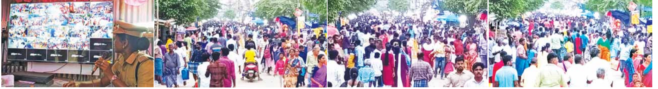
▶ தீபாவளி பண்டிகையை யோட்டி நேற்றைய தினம் புதுக்கோட்டை கீழ் ராஜ வீதியில் வீட்டுக்கு தேவையான பொருட்களை வாங்கிச் செல்ல ஏராளமான மக்கள் குவிந்திருந்ததையும் அதனை கண்காணிப்பு கேமரர்கள் மூலம் புற காவல் நிலையத்திலிருந்து கண்காணிக்கும் பணியில் காவல்துறையினர் ஈடுபட்டிருப்பதையும் படத்தில் காணலாம்