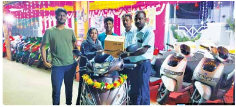
▶ புதுக்கோட்டை சாரதா மோட்டார்ஸ் சார்பில் தீபாவளி எக்ஸ்சேஞ்ச் & லோன் திருவிழா கம்பெனி வளாகத்தில் நடைபெற்று வருகிறது. புதிதாக டிவிஎஸ் வாகனம் வாங்கும் அனைத்து வாடிக்கையாளர்களுக்கும் ரூபாய் 3000 வரை சிறப்பு தள்ளுபடி வழங்கப்படுகிறது. இந்த சலுகை நவம்பர் 15 ஆம் தேதி வரை இருக்கும் என்று தெரிவிக்கப்பட்டுள்ளது.