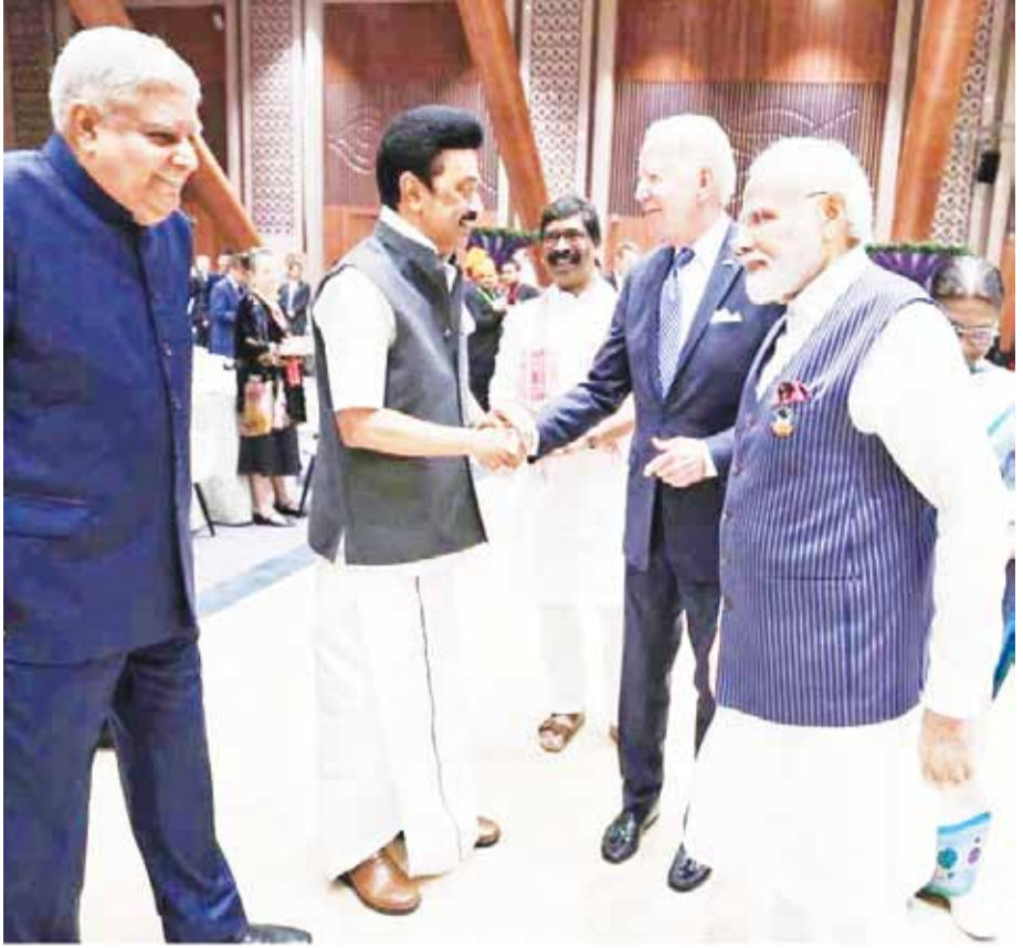
புதுதில்லியில் நடைபெற்ற ஜி-20 உச்சி மாநாட்டின் யோட்டி, இந்திய குடியரசுத் தலைவர் திரௌபதி முர்மு சனிக்கிழமை அளித்த விருந்தில், தமிழ்நாடு முதலமைச்சர் மு.க.ஸ்டாலின் கலந்துகொண்டபோது, அமெரிக்க நாட்டின் அதிபர் ஜோ பைடனை சந்தித்து பேசினார். இந்நிகழ்வின் போது இந்தியப் பிரதமர் நரேந்திர மோடி, துணைத் தலைவர் ஜகதீப் தன்கர் ஆகியோர் உடனிருந்தனர்.

இந்நிலையில் இரண்டாம் நாளான நேற்று காலை டெல்லி ராஜகாட் பகுதியில் உள்ள மகாத்மா காந்தி நினைவிடத்துக்கு உலகத் தலைவர்கள் வருகை தந்தனர். மழைக்கு நடுவே வருகை தந்த தலைவர்களை பிரதமர் மோடி வரவேற்றார். காந்தி நினைவிடத்தில் அஞ்சலி செலுத்திய பின்னர் உலகத் தலைவர்கள்