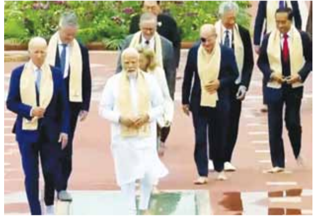
டெல்லியில் சனிக்கிழமை அமெரிக்க அதிபர் ஜோ பைடன், பிரிட்டிஷ் பிரதமர் ரிஷி சுனக் உட்பட பல்வேறு உறுப்பு நாடுகளின் தலைவர்கள் பங்கேற்றனர்.

புதுடெல்லி, செப். 11- ஜி-20 உச்சி மாநாட்டின் இரண்டாம் நாள் கூட்டம் நேற்று நிறைவடைந்தது. இந்நிலையில் அடுத்த மாநாட்டை நடத்தும் அதிகாரம் பிரேரணை தலைமையேற்கும் ஒப்படைக்கப்பட்டது. ஜி-20 அமைப்பின் இந்த ஆண்டுகான தலைமையை இந்தியா ஏற்றி ருக்கிறது. இதையடுத்து, நாடு முழுவதும் பல்வேறு மாநாடுகள் நடைபெற்றன. இந்நிலையில், ஜி- 20 உச்சி மாநாடு