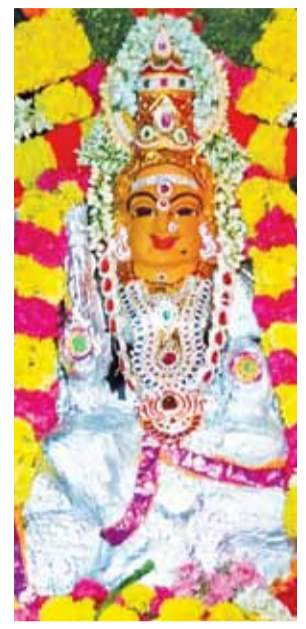
திருவப்பூர் அருள்மிகு முத்துமாரியம் மன் திருக்கோவிலில் ஆவணி மாத நான்காவது வாரத்தை முன்னிட்டு முத்துமாரி அம்மனுக்கு நடைபெற்ற அபிஷேகத்தை தொடர்ந்து சந்தனகாப்பு அலங்காரத்தில் பக்தர்களுக்கு அருள் பாலித்தார் நிகழ்வில் ஏராளமான பொதுமக்கள் கலந்துகொண்டு சுவாமி தரிசனம் செய்தனர்.

மாநாடு நடைபெறும் பாரத் மண்டபத்துக்கு வந்தனர். அங்கே அவர்கள் மரக்கன்றுகளை நடனம். பின்னர் ஜி20 உச்சி மாநாட்டில் முக்கிய கருத்தரங்குகள் நடைபெற்றன. அதன் தொடர்ச்சியாக ஜி-20 கூட்டமைப்பின் அடுத்த மாநாட்டை நடத்தும் அதிகாரத்தை பிரதமர் மோடி பிரேரணை நூட்டு அதிபரிடம் ஒப்படைத்தார். பின்னர் பேசிய அவர், டிசம்பர் மாதம் வரை ஜி20 தலைமைப் பொறுப்பில் இருப்பதால் நவம்பரில் காணொலி மூலமாக ஒரு கூட்டத்தை நடத்தவிருப்பதாகவும் அறிவித்தார். பின்னர் பிரதமர் மோடி ஜி20 கூட்டம் நிறைவு பெறுவதாக அதிகாரபூர்வமாக அறிவித்தார். மாநாட்டின் இறுதி உரையின் போது பிரதமர் மோடி பேசுகையில், "ஒரே பூமி, ஒரே குடும்பம் பற்றிப் பேசுவதற்கு ஒரு நேர்மறையான தளமாக உருவாகியுள்ள திருப்தி எனக்கு ஏற்பட்டுள்ளது" என்றார்.