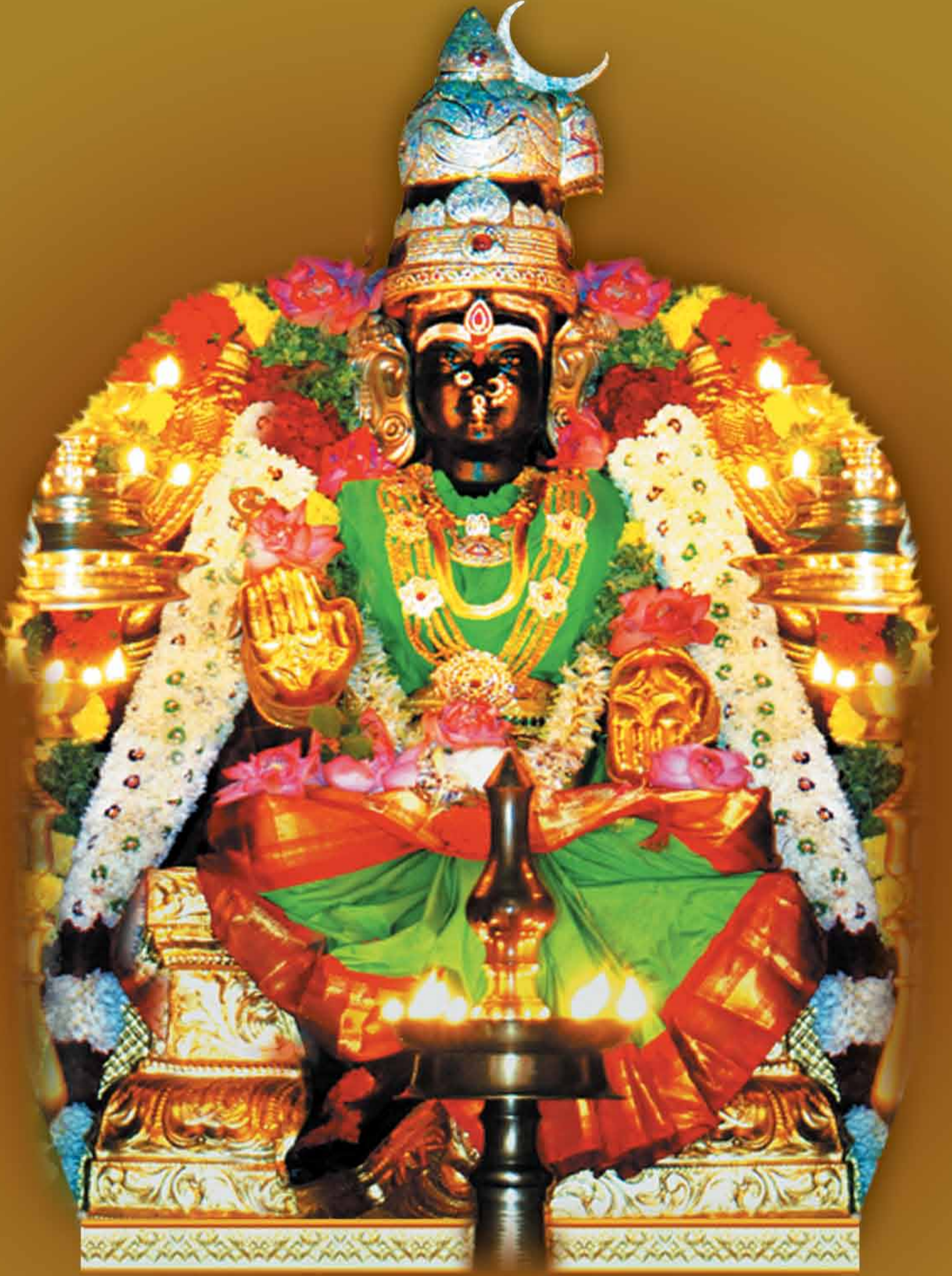
ஸ்ரீ புவனேஸ்வரி அம்மன் புதுக்கோட்டை