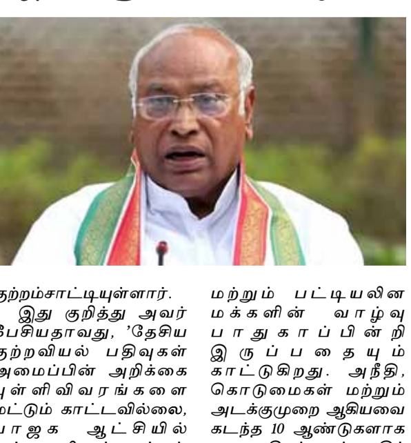
குற்றம் சாட்டியுள்ளார். இது குறித்து அவர் பேசியதாவது, "தேசிய குற்றவியல் பதிவுகள் அமைப்பின் அறிக்கை புள்ளிவிவரங்களை மட்டும் காட்டவில்லை. அடக்குமுறை ஆகியவை கடந்த 10 ஆண்டுகளாக பாஜக செய்துவந்த சதித்

புதுடில்லி, டிச. 9- பாஜக ஆட்சியில் நாடு முழுவதும் பட்டியலினத்தவர்கள் மற்றும் பழங்குடியினருக்கு எதிரான குற்றங்கள் அதிகரித்துள்ளதாக காங்கிரஸ் தலைவர் மல்லிகார்ஜுன காரகே குற்றம் சாட்டியுள்ளார். காங்கிரஸ் தலைவர் மல்லிகார்ஜுன காரகே, பாஜக ஆட்சியில் நாடு முழுவதும் பட்டியலினத்தவர்கள் மற்றும் பழங்குடியினருக்கு எதிரான குற்றங்கள் புள்ளிவிவரங்களை மட்டும் காட்டவில்லை. பாஜக ஆட்சியில் பட்டியலினத்தவர்கள்