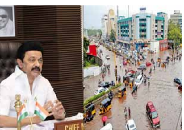
பேரிடர் மட்டுமல்ல, ஒட்டுமொத்த தமிழ்நாட்டுக்குமே ஏற்பட்டுள்ள பேரிடர். மழைநீர் வடிகால் பணிகளை முன் கூட்டியே திட்டமிட்டு செயல்படுத்தி இருந்ததால் தான் பேரழிவு தவிர்க்கப்பட்டது. அதேபோல் அனைத்துத் துறைகளும் பேரிடரை எதிர்கொள்ள தயார் நிலையில் இருந்தும், முன்னெச்சரிக்கை நடவடிக்கைகள் எடுத்து வைத்திருந்தும் இணைந்து மக்களைக் காத்துள்ளது. இருப்பினும் பாதிக்கப்பட்ட பகுதிகளில் முழுவீச்சில் நடைபெற்ற மீட்புப் பணிகளின் காரணமாக மூன்று நாட்களுக்குள்

சென்னை, டிச. 9- மிக்கஜாம் புயல் நிவாரணத்துக்காக முதலமைச்சர் மு.க.ஸ்டாலின் ஒருமாத சம்பளத்தை வழங்கினார். இது குறித்து வெளியிடப்பட்டுள்ள செய்தியில், மிக்கஜாம் புயல் பேரிடர் பாதிப்பிலிருந்து மீள முதலமைச்சர் பொது நிவாரண நிதிக்கு என்னுடைய ஒரு மாத ஊதியத்தை வழங்குகின்றேன். அனைத்து சட்டமன்ற நாடாளுமன்ற உறுப்பினர்களும் நிதி அளித்திடும்மாறு வேண்டுகோள் விடுக்கின்றேன். மிக்கஜாம் புயலால் கடந்த டிசம்பர் 2 முதல் 4ம் தேதி வரை சென்னை மற்றும் சுற்றுப்புற மாவட்டங்களில் கொட்டித் தீர்த்த மழை என்பது, 47 ஆண்டுகால வரலாற்றில் இல்லாத அளவிலான பெருமழை. இந்த இயற்கைப் பேரிடரால் ஏறத்தாழ 1 கோடிக்கும் அதிகமான மக்கள் பாதிக்கப்பட்டுள்ளார்கள். இந்தப் பேரிடர் சென்னை மற்றும் சுற்றுப்புற மாவட்டங்களுக்கு ஏற்பட்டுள்ள