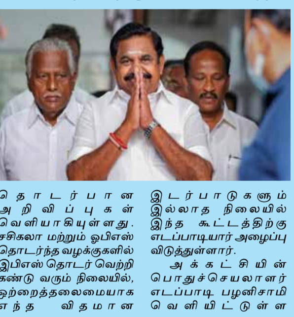
தொடர்பான அறிவிப்பு உள்ள வெளியாகியுள்ளது. சசிகலா மற்றும் ஓபிஎஸ் தொடர்ந்த வழக்குகளில் இயிஎஸ் தொடர்வெற்றி கண்டு வரும் நிலையில், ஒற்றைத்தலைமையாக செயற்குழு கூட்டம்