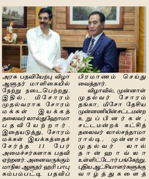
அரசு பதவியேற்பு விழா ஆளுநர் மாளிகையில் நேற்று நடைபெற்றது. இதில், மிசோரம் முதல்வராக சோரம் மக்கள் இயக்கத் தலைவர் லால்துஹோமா பதவியேற்றார். இதையடுத்து, சோரம் மக்கள் இயக்கத்தைச் சேர்ந்த 11 பேர் அமைச்சர்களாக பதவி ஏற்றனர். அனைவருக்கும் மாநில ஆளுநர் ஹரி பாபு கம்பம் பட்டி பதவிப்

ஜில்லாவில், டிச. 9- மிசோரம் முதல்வராக சோரம் மக்கள் இயக்கத் தலைவர் லால்துஹோமா பதவியேற்றார். மாநில ஆளுநர் ஹரி பாபு கம்பம் பட்டி அவருக்கு பதவிப் பிரமாணம் செய்து வைத்தார். மிசோரம் கட்டமாக கடந்த நவம்பர் 7ம் தேதி தேர்தல் நடைபெற்றது. மொத்தமுள்ள 40 சட்டப்பேரவைத் தொகுதிகளில் 27 தொகுதிகளைக் கைப்பற்றி சோரம் மக்கள் இயக்கம் ஆட்சியைப் பிடித்தது. இதையடுத்து, மிசோ தேசிய முன்னணியின் தலைவரான சோரம் தங்கா முதல்வர் பதவியை ராஜினாமா செய்தார். இந்நிலையில், புதிய