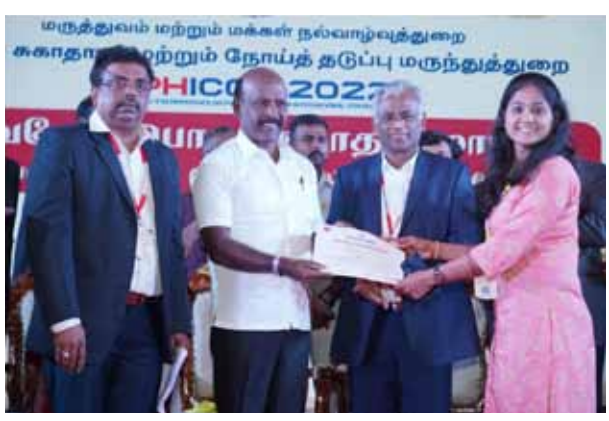
▶ அமைச்சர் மா.கப்பிரமணியன், செங்கல்பட்டு மாவட்டம், மாமல்லபுரத்தில் நேற்று பொது சுகாதாரம் மற்றும் நோய்த்தடுப்பு மருந்து துறையின் நூற்றாண்டு நிறைவு விழாவில், துறை சார்பாக நடத்தப்பட்ட போட்டிகளில் வெற்றி பெற்றவர்களுக்கு சான்றிதழ்கள் மற்றும் நல்வாழ்வுத் துறை அரசு முதன்மைச் செயலாளர் ப.செந்தில்குமார், பொது சுகாதாரம் மற்றும் நோய் தடுப்பு மருந்துத் துறை இயக்குநர் தி.சி.செல்வவிநாயகம் மற்றும் உயர் அலுவலர்கள் உடனிருந்தனர்.