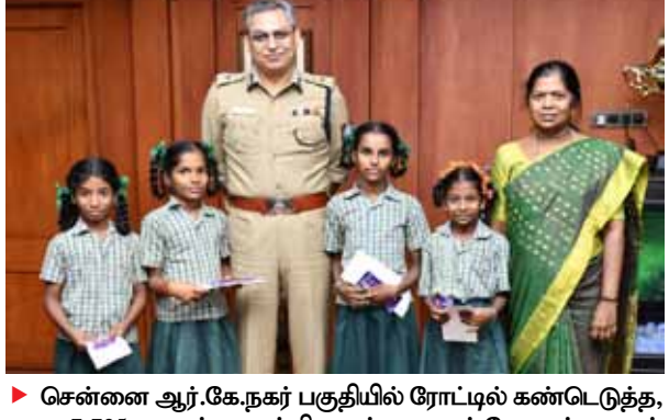
▶ சென்னை ஆர்.கே.நகர் பகுதியில் ரோட்டில் கண்டெடுத்த, ரூ.7,705 பணம் அடங்கிய பர்சை ஆர்.கே.நகர் காவல் நிலையத்தில் இன்ஸ்பெக்டர் ரவியிடம் ஒப்படைத்த 5-ம் வகுப்பு மாணவிகளை நேரில் அழைத்து பாராட்டிய காவல் ஆணையாளர் சங்கர் ஜலீலால் மாணவிகளுக்கு எழுப்பியுள்ள காவல் அருங்காட்சியகத்தை சுற்றி காண்பித்து மகிழ்ச்சிப்படுத்தினார்.