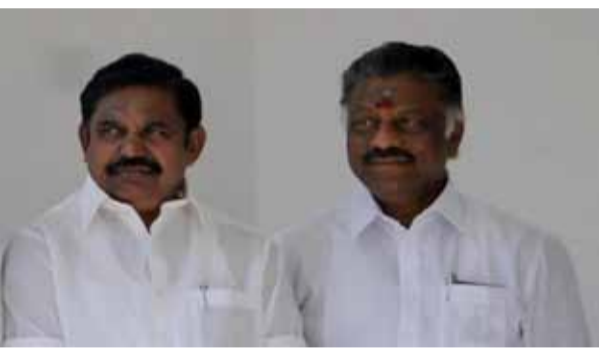
புதுக்கோட்டை, ஜூன். 9 - பொதுக்குழுவுக்கு அதிகாரம் உள்ளது.

சென்னை, ஜூன். 9 - ஒற்றைத்தலைமையை மீண்டும் கொண்டுவந்ததன் மூலம் கட்சியின் பழைய நிலை மீட்டெடுக்கப்பட்டுள்ளது. நிர்வாகிகளை நியமித்து இணையாக கட்சி நடத்தும் நபர், பதவிப் பசிகாரணமாகவே வழக்கு தொடர்ந்துள்ளதாக அதிமுக தரப்பில் சென்னை உயர் நீதிமன்றத்தில் வாதிடப்பட்டுள்ளது.