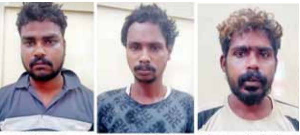
மணல் கடத்த முயன்ற வழக்கில் சிறையில் அடைக்கப்பட்ட குற்றவாளிகளை படத்தில் காணலாம்.