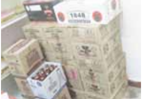
அப்பகுதியில் ரோந்து பணி மேற்கொண்டனர். அப்பொழுது புதுப்பாளையம் ஆரணி ஆற்றின் அருகே ஒருவர் மது பாட்டில்களை வைத்துக்கொண்டு விற்பனை செய்து கொண்டிருப்பதை போலீசார் கண்டுபிடித்தனர். எனவே, அங்கு சென்றபோது