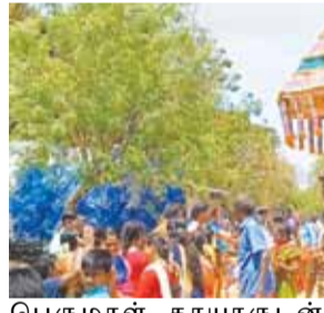
பெருமாள் தாயார்டுடன் எழுந்தருளினார். இரண்டாவது தேரில் திருமங்கை ஆழ்வார் எழுந்தருளினார். இரண்டு தேர்களுக்கும் பொருள் செய்து கொண்டு திரளான பக்தர்கள் வடம் பிடித்து இழுத்து,