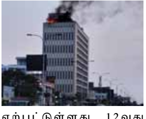
ஏற்பட்டுள்ளது. 12வது மாடியின் மேல்தளத்தில் வைக்கப்பட்டுள்ள பெயர்

சென்னை, ஏப். 03 அண்ணா சாலையில் உள்ள எல்ஜி கட்டிடத்தில் தீ விபத்து ஏற்பட்டுள்ளது. சென்னை அண்ணா சாலையில் உள்ள எல்ஜி கட்டிடத்தில் நேற்று மாலை 6 மணியளவில் கட்டிடத்தின் மேல் உள்ள எல்ஜி பெயர் பலகையில் தீபுரெ எ தீ விபத்து