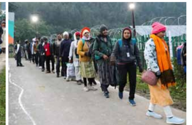
இமயமலைத் தொடரில் தெற்கு காஷ்மீரில் இயற்கையாக தோன்றும் அமர்நாத் பனிலிங்கத்தை வழிபட ஆண்டுதோறும் லட்சக்கணக்கான பக்தர்கள் புனித பயணம் மேற்கொள்கின்றனர். காஷ்மீரின் ஹல்காம் மற்றும் பாஸ்டால் ஆகிய இரு வழித்தடங்களில் பக்தர்கள் புனித பயணம் தொடங்கியது. இந்த ஆண்டுக்கான முன்பதிவு கடந்த ஏப்ரலில் தொடங்கியது. இதன்படி அமர்நாத் புனித யாத்திரைக்கு 3 லட்சத்துக்கும் மேற்பட்டோர் முன்பதிவு செய்துள்ளனர்.