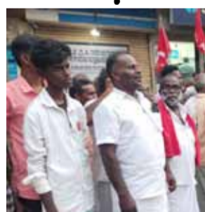
முன்னிலை வைத்தார், நிகழ்ச்சியில் நாட்டின் புகழ் சிபிஎம்எல் கட்சியினர் கண்டன ஆர்ப்பாட்டம்.

ஆவுடையர்கோவில், ஜூலை-2- மேடி ஆட்சியை வெளியேற்றுவோம் தேசிய ஊர்க்கு வேலை உறுதி திட்டத்தை பாதுகாப்போம் என்ற பெயரில் ஆவுடையர்கோவில் கடைவீதியில் சிபிஎம்எல் கட்சியினர் கண்டன ஆர்ப்பாட்டம்.