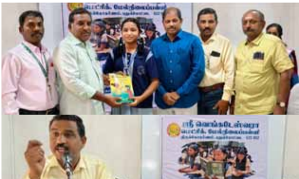
மன்றம் தொடங்கிய பெருமை கொள்கிறது. இன்றைக்கு நூல்களை மதிப்புரை செய்து மாணவர்கள் மிகச் சிறப்பாக சேர்னர். தொடர்ந்து எல்லா மாணவர்களும் நூல்களை வாசிப்பதிலும், படித்தல் பிடித்ததை விவாதிப்பதிலும் கலந்துகொள்ள வேண்டும் என்று கோரியது.