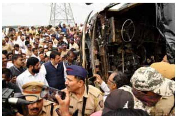
கட்டுமானத் தரத்தை குறைக்கிறுவது சரியில்லை" என்று அம்மாநில துணை முதல்வர் தேவேந்திர பட்னாவில் தெரிவித்துள்ளார்.

புல்தானா, ஜூலை. 02- மகாராஷ்டிராவின் யவத்மாலில் இருந்து புனே நோக்கிச் சென்ற பேருந்து சமருத்தி மகாமார்க் விரைவுச் சாலையில் புல்தானாவில் திடீரென தீப்பிடித்து விபத்து ஏற்பட்டது. இந்த விபத்தில் சிக்கி 26 பேர் உயிரிழந்தனர். நள்ளிரவுக்குப் பின் 2 மணியளவில் இறந்ததுயரச்சம்பவம் நிகழ்ந்துள்ளது. தீ விபத்தில் சிக்கி மேலும் பலர் பலத்த காயமடைந்தனர்.