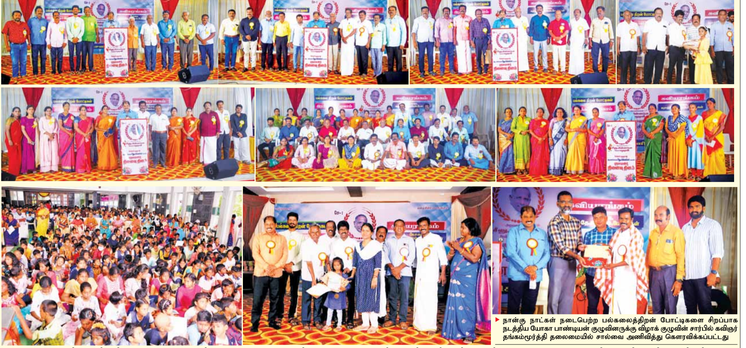
▶ புதுக்கோட்டை சத்தியமூர்த்தி நகரில் உள்ள மஹராஜ் மஹாலில் 'அறமனச்செம்மலும் 60 கவிஞர்களும்' எனும் தலைப்பில் 60 கவிஞர்களின் கவிதை அணிவகுப்பு நேற்று நடைபெற்றது. கவிஞர்கள் 'சிந்தை நிறைந்த சீனு சின்னப்பா' என்ற தலைப்பிலும், உழைப்பாளர் தினத்தைக் குறிக்கும் வகையில் 'அனுதினமும் மே தினமே' எனும் தலைப்பிலும் கவிஞர்களின் சங்கமம் நடைபெற்றது.