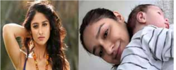
எடுத்து நீண்ட நாளாகி விட்டது என்று உணர்ந்தேன். முழுநேரம் குழந்தையைப் பார்த்துக் கொண்டிருப்பதுபோலவே இருந்தாலும் எனக்கான நேரம் கிடைக்கவில்லை. பெரும்பாலும் டைனாமிக் குழந்தை என் முடிவை

மும்பை : மார். 3, 'பல நாட்கள் தூங்காமல் தவித்தேன், எனக்கான நேரம் என்பதே கிடைக்கவில்லை. செல்ஃபி எடுத்து ரொம்ப நாட்கள் ஆகிவிட்டது என்பது பரிந்து. உண்மையில் தாய்மை கடினம் தான்' என நடிகை இலியானா கூறியுள்ளார். தனக்குத் திரும்பும் நடந்தது, தனது கணவர் யார் என்பது போன்ற விவரங்களை நடிகை இலியானா நீண்ட காலமாகவே வெளிப்புலருக்கு சொல்லாமல் வைத்திருந்தார். பின்பு திடீரென ஒருநாள்