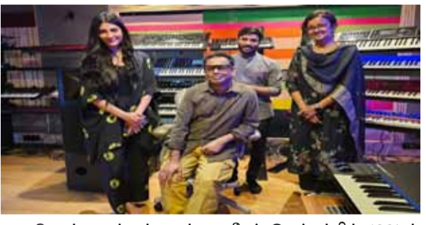
என பெயர் வைத்துள்ளனர். தமிழில் இதற்கு முன் ஆண்டு இதே தலைப்பில்

சென்னை : மார். 3, கிருத்திகா உதயநிதி இயக்கும் 'காதலிக்க நேரமில்லை' படத்தின் முதல் பாடலை ஸ்ருதிஹாசன் பாடியுள்ளார். சிவா, பிரியா ஆனந்த் நடித்த 'வணக்கம் சென்னை' படம் மூலம் இயக்குநர் ஆனவர் கிருத்திகா உதயநிதி. அடுத்த விஜய் ஆண்டனி நடித்த 'காசி', 'பேப்பர் ராக்கெட்' என்ற