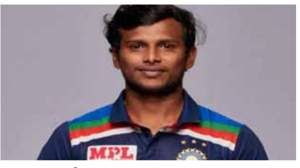
மாணவர்கள் விளையாட்டில் ஆர்வம் செலுத்தாமல் செல்போன் மோகத்தில் உள்ளனர். மாணவர்கள் விளையாட்டு, படிப்பு இரண்டுக்கும் முக்கியத்துவம் தர வேண்டும். நான் போதிய படிப்பின்மை காரணமாக மொழிப் பிரச்சினையால் பாதிக்கப்பட்டேன். பள்ளியில் படிக்கும்போது செங்கல் குளை, கட்ட வேலை, ரொடுபோடும் வேலை என பல வேலைகளைச் செய்துள்ளேன். இதையெல்லாம் தடையாக

மயிலாடுதுறை : மார். 3, "விளையாட்டோடு படிப்பும் மிகவும் முக்கியம். ஏனென்றால் சரியாக படிக்காததால், சர்வதேச போட்டிகளில் விளையாடும் போது மொழிப் பிரச்சினையை எதிர்கொண்டேன்", என்று கிரிக்கெட் வீரர் நடராஜன் தனது அனுபவத்தை மனவர களையே பகிர்ந்து கொண்டார். மயிலாடுதுறையில் அகாடமி திறப்பு விழாவில், தமிழகத்தைச் சேர்ந்த சர்வதேச கிரிக்கெட் வீரர் நடராஜன் கலந்துகொண்டார். அகாடமியை திறந்துமானால், மானிக்கம் மத்தியில் பேசிய நடராஜன், "பள்ளியில் படிக்கும் போது வறுமையின் காரணமாக ஷூ வாங்க முடியாத நிலையில், வெறும் கால்களுடனே முன்று வருடங்கள் பிராக்டிஸ் செய்தேன். வீட்டில் நல்ல