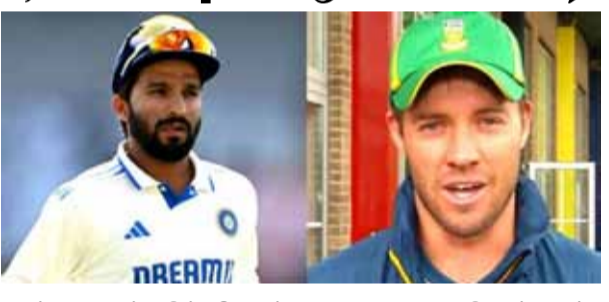
ரஜத் படிதாரைக்கு இந்த தொடர் வாழ்க்கையின் நினைவில் கொள்ள விரும்பத் தகாத தொடராகியுள்ளது. ஆனால் இந்திய அணியின் பெரிய விஷயம் என்னவெனில் மற்றவர்கள் அபாயமான ஆட்டத்தை ஆடி அணிக்கு வெற்றி தேடித் தரும் நிலையில் ரஜத் படிதாரை தேர்வு வியடைந்தாலும் அணியில் நீக்க வாய்ப்பு உள்ளது. அவரது குணாதிசியமும் அணுகுமுறையும் ஈர்க்கக்

தரம்சலா : மார். 3, தரம்சலாவில் நடைபெறவிருக்கும் இங்கிலாந்துக்கு எதிரான 5-வது டெஸ்ட் போட்டியில் ரஜத் படிதாரைக்கு வாய்ப்பு வழங்க வேண்டும். அவருக்கு இன்னும் சில வாய்ப்புகள் வழங்கிய பிறகு முடிவுக்கு வர வேண்டும் என்று தென் ஆப்பிரிக்க லெஜன்ட், 360 டிகிரி பேட்டர் ஏ.பி.டிவில்லியர்ஸ் கூறியுள்ளார். இங்கிலாந்துக்கு எதிராக கோலி ஆடவில்லை என்பதால் வாய்ப்பு பெற்ற ரஜத் படிதாரை, உள்நாட்டு கிரிக்கெட் தொடர்களில் குறிப்பாக ரஞ்சி போட்டிகளில் எக்ச்செக்சமாக ரன்களைக் குவித்த தையடுத்து வாய்ப்பு பெற்றார். ஆனால் இங்கிலாந்துக்கு எதிரான 3 டெஸ்ட் போட்டிகளில் அவர்