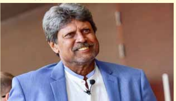
சில வீரர்களுக்கு இம்சை கொடுக்கலாம். இந்த முடிவின் மூலம் உள்ளூர் கிரிக்கெட்டை பிசிஐ காத்துள்ளது. சரியான நேரத்தில் இந்த முடிவு

மும்பை : மார். 3, இந்திய ஆவர்த்திக் கெட் அணிக்கான வீரர்களின் ஆண்டு ஒப்பந்தத்தில் சர்வதேச போட்டிகளில் விளையாடாத சமயங்களில் உள்ளூர் கிரிக்கெட்டில் வீரர்கள் விளையாட வேண்டும் என பிசிஐ தெரிவித்திருந்தது. இந்த முடிவை வரவேற்பதாக தெரிவித்துள்ளார் இந்திய அணியின் முன்னாள் கேப்டன் கபில் தேவ். அண்மையில் வெளியான வீரர்களுக்கான ஆண்டு ஒப்பந்தத்தில் ஸ்ரேயஸ் ஐயர் மற்றும் இஷான் கிஷன் நீக்கப்பட்டனர். உள்ளூர் கிரிக்கெட்டில் தங்களது மாநில அணிக்கான அவர்கள் விளையாட மறுத்தது இதற்கு காரணமாக சொல்லப்பட்டது. இந்த முடிவை முன்னாள் கிரிக்கெட் வீரர்கள், விமர்சகர்கள் மற்றும் வல்லுநர்கள் ஆதரித்தும், விமர்சித்தும் இருந்தனர். "தேசத்தை விட யாரும் பெரியவர்கள் அல்ல என்பதை இது சுட்டிக்காட்டுகிறது. பிசிஐ-யின் இந்த முடிவு