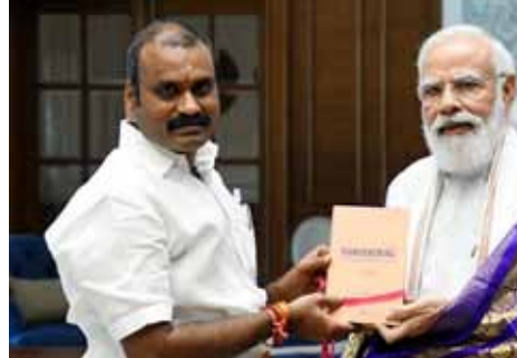
இருந்து மாநிலங்களவைக்கு போட்டியிடுகிறார். நீலகிரியில் எல்.முருகன் போட்டியிடுவார் என்று கூறப்பட்ட நிலையில் மாநிலங்களவை வேட்பாளராக அறிவிக்கப்பட்டுள்ளது. தற்போது எல்.முருகன் மத்தியப்பிரதேச மாநிலத்தில் இருந்து மாநிலங்களவை உறுப்பினராக உள்ளார். மத்திய அமைச்சர் எல். முருகனின் எம்.பி. பதவிக் காலம் வரும் ஏப்ரலில் முடிவடைய உள்ளதால்

டெல்லி : பி.பி. 15- மத்திய பிரதேசத்தில் இருந்து மாநிலங்களவை உறுப்பினர் பதவிக்கு மத்திய இணை அமைச்சர் எல். முருகன் மீண்டும் தேர்வாகிறார். மாநிலங்களவைக்கு வரும் 27ம் தேதி தேர்தலும், அன்றைய தினமே வாக்கு எண்ணிக்கையும் நடைபெறுகிறது. இதற்கான வேட்புமனுக்களைத் தாக்கல் செய்ய இன்று கடைசி நாள். மாநிலங்களவைத் தேர்தலில் போட்டியிடும் வேட்பாளர்கள் பட்டியலை பாரதிய ஜனதா கட்சி வெளியிட்டது. மாநிலங்களவைத் தேர்தலில் மத்திய அமைச்சர் எல். முருகன் மத்திய பிரதேசத்தில் இருந்து போட்டியிடுகிறார். மத்திய அமைச்சர் அஸ்வினி வைஷ்ணவ் ஒடிசா மாநிலத்தில் மீண்டும் போட்டியிடுகிறார். நாடாளுமன்ற தேர்தலில் போட்டியிடுவார் என எதிர்பார்க்கப்படும் நிலையில் மாநிலங்களவை உறுப்பினராகிறார். எல். முருகன் 2021 சட்டமன்ற தேர்தலில் தாராயுரம் தொகுதியில் போட்டியிட்டு தோல்வியடைந்தார். மத்திய அமைச்சரானதன் காரணமாக 2021-ல் மத்தியப்பிரதேசத்தில் இருந்து எம்.பி.யாக தேர்வானார்.