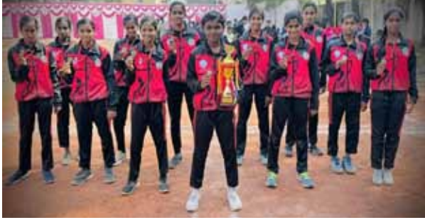
மகளிர் பிரிவில் தமிழக அணி வெண்கலப் பதக்கம் கைப்பற்றியது. லீக் சுற்றில் தமிழக மகளிர் அணி புதுச்சேரியிடம் தோல்வி அடைந்து பதக்கம் வெல்லும் வாய்ப்பை இழந்தது. அதே வேளையில்

சென்னை : பிப். 15, மகாராஷ்டிர மாநிலம் ஷேகாஸில் உள்ள மவுலி பள்ளியில் தேசிய சப்-ஜூனியர் அட்யா ப்யா சாம்பியன்ஷிப் நடைபெற்றது.