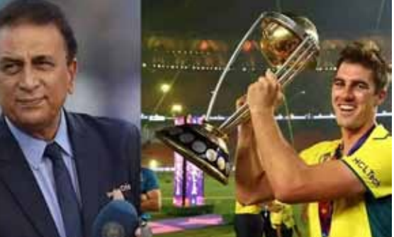
குறைபாடு நீங்கும். கடந்த முறை சில முக்கியமான போட்டிகளில் ஐதராபாத் அணியின்

வாய்ப்புள்ளது. இது குறித்து இந்திய அணியின் முன்னாள் கேப்டன் சனில் கவால்சுக் கூறுகையில், ‘ஏலத்தில் ஐதராபாத் அணி கம்மின்சை வாங்கியதை புத்திசாலித்தனமான முடிவாக நான் பார்க்கிறேன். அவர் கொஞ்சம் அதிக விலைக்கு வாங்கப்பட்டு இருந்தாலும், அவரது வருகையால் கடந்த ஆண்டு கம்மின்ஸ் நியமிக்கப்பட்டு