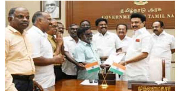
தமிழ்நாடு அரசு GOVERNMENT TAMIL NADU. இன்று நடைபெற இருந்த வேலை நிறுத்தப் போராட்டம் ஒத்திவைக்கப்பட்டுவதாக ஜாக்பே ஜியோ அமைப்பினர் அறிவித்துள்ளனர்.

சென்னை: பி.பி. 15- இன்று நடைபெற இருந்த வேலை நிறுத்தப் போராட்டம் ஒத்திவைக்கப்பட்டுவதாக ஜாக்பே ஜியோ அமைப்பினர் அறிவித்துள்ளனர். பழைய ஓய்வுதிய திட்டம் உள்ளிட்ட 10 அம்ச கோரிக்கைகளை வலியுறுத்தி இன்று வேலை நிறுத்தப் போராட்டத்தை ஜாக்பே - ஜியோ அமைப்பினர் அறிவித்து இருந்த நிலையில், அந்த போராட்ட அறிவிப்பை திருப்பி பெற்றனர். முதல்வர் மு.க.ஸ்டாலினை சந்தித்து ஆலோசனை நடத்திய நிலையில், இந்தப் போராட்ட அறிவிப்பை திரும்பப் பெற்றனர். இது தொடர்பாக செய்தியாளர்களைச் சந்தித்த ஜாக்பே ஜியோ அமைப்பினர், "போய் ஓய்வுதிய திட்டத்தை பல மாநிலங்கள் செயல்படுத்தினிடன. இதை முதல்வரிடம் தெரியப்படுத்திய போது, நான் தராமல் யார் தர போகிறார்கள். நிச்சயம் பழைய ஓய்வுதியும் வழங்கப்படும். மேலும், மிக விரைவில் நீதி நிலைசரிசெய்தபிறகு உங்களை கோரிக்கைகள் ஒவ்வொன்றாக சரி செய்யப்படும்" என்று முதல்வர் ஸ்டாலினை எங்களிடம் உறுதியளித்தார். முதல்வரை சந்தித்ததன் அடிப்படையில் அவர் அளித்த உறுதியின் அடிப்படையில் இன்று நடைபெற இருந்த போராட்டத்தை ஒத்திவைக்க முடிவெடுத்துள்ளோம். சென்னை: பி.பி. 15-