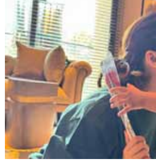
சென்னை : பிப். 15, காதலர் தின ஸ்பெஷலில் நடிக்க நயன்தாரா தனது இரு மகன்களையும் கொஞ்சியு முத்தமிட்டபடி இருக்கும் கியூட்டானப் புக்கப்பட்டுகளை பகிர்ந்துள்ளார்.

ஒரு அம்மாவாக தனது இரு மகன்களைக் கொஞ்சி முத்தமிட்டு அனைத்தபடி இருக்கும் கியூட்டானப் புக்கப்பட்டுகளை பகிர்ந்துள்ளார். இந்தப் புக்கப்பட்டுகளைப் பகிர்ந்து, ‘என் உயிர், உலகம் இருவரையும் நான் அதிகம் நேசிக்கிறேன். என்னுடைய இந்த வருடக் காதலர் தினத்தை முன்பெப்போதும் விட சிறந்ததாக கியூட்டானப் நன்றி’ என உருகியுள்ளார் நயன்தாரா. மேலும், இருமகன்களுக்கும் நேரேஜா கொடுத்துள்ளதற்கான அன்பை வெளிப்படுத்தியுள்ளார். குட்டைலுக்கும் நயன்தாரா-விக்கேஷ்வின் ஜோடிக்கும் ரசிகர்கள் தங்கள் காதலர் தின வாழ்த்துகளைக் கூறி வருகின்றனர்.