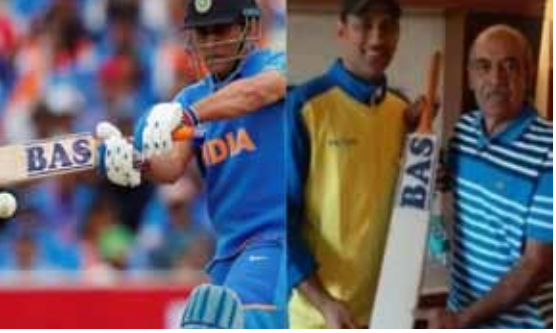
எனக்கு உதவிபுரிக்கிறீர்கள். இப்போது நான் உங்களுக்கு எதாவது செய்ய வேண்டும்” என்று எங்கள் நிறுவன ஸ்டிக் களை பயன்படுத்தினார் தோனி. உண்மையிலேயே அவருக்கு மிகப் பெரிய மனது” என்று BAS நிறுவன உரிமையாளர் நெகிழ்ந்து பேசியிருக்கிறார். தோனியின் படமொன்று ‘MS Dhoni The

அதை தன்னுடைய பேட்டில் பயன்படுத்தப்போவதாகவும் கூறினார். மேலும், இதற்காக எந்தவிதமான பணமும் பெற்றுக்கொள்ளப் போவதில்லை என்றும் தோனி தெரிவித்தார். ஒரு நட்சத்திர வீரர் இது போல பணமில்லாமல் பேட்களை பயன்படுத்தப்போகிறார் என்றால் பல கோடி ரூபாய் ஒப்பந்தங்களை இழக்க வேண்டியிருக்கும். இதனை தோனியிடம் வெளிப்படுத்தி இதெல்லாம் வேண்டாம் என்று மறுத்தேன். ஆனால் தோனியோ, ‘எனது ஆரம்பகால கட்டத்தில் நீங்கள்