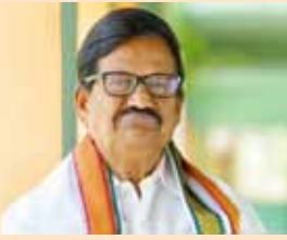
முழக்கத்துடன் விவசாயிகள் போராட்டம் திட்டமிட்டது. அந்த பேரணியை முழுக்கிழைக்கவிட உத்திரப் பிரதேசம், ஹரியானா பாஜக அரசுகள் நெடுஞ்சாலைகளில் விவசாயிகள் போராட்டம் செய்து கமிட்டித் திட்டம், கட்டன் நிரவாரணம், மத்தியநாட்டில் குறைந்தபட்ச நிவாரணத் தொகை என பல கோரிக்கைகளை முன்வைத்தனர். இது குறித்து மோடி அரசு விவசாயிகளை நோக்கி உத்தரவு பிறப்பித்தது மாவட்ட செயலாளர் இல்லை. பாஜக அரசின் விவசாய விரோதப் போக்குக்கு எதிராக பல்வேறு விவசாய சங்கங்கள் நாளை காலை 6 மணி முதல் மாவை 4 மணி வரை நாடு முழுவதும் பாரத் பந்த் நடத்த வேண்டும் என அழைப்பு விடுத்திருக்கின்றன. இந்த அழைப்பை ஏற்றுக் கொண்டு அகில இந்திய காங்கிரஸ் தமிழ்நாடு காங்கிரஸ்க்கு வழங்கப்பட்ட அறிவுறுத்தல் படி தற்போது மாவட்ட காங்கிரஸ் தலைவர்களும் தீவிர முயற்சிகளை மேற்கொள்ள வேண்டும் என அன்போடு கேட்டுக் கொள்கிறேன்” என கே.எஸ்.அழகிரி கூறினார்.

சென்னை : பி.பி. 15- பாரத் பந்த் வெற்றிகரமாக தமிழகத்தில் நடைபெற்று மாவட்ட காங்கிரஸ் கமிட்டித் தலைவர்களும் தீவிர முயற்சிகளை மேற்கொள்ள வேண்டும் என தமிழ்நாடு காங்கிரஸ் கமிட்டித் தலைவர்கள் கே.எஸ். அழகிரி வலியுறுத்தியுள்ளார். இது குறித்து நேற்று அவர் வெளியிட்டிருப்பது அறிக்கையில், “கடந்த 2014 மக்களவை தேர்தலின் போது விவசாயிகளின் வருமானத்தை இரு மடங்காக கூட்டுவேன், பாடூர் எம்.எல். சுவாமிநாதன் குழு பரிந்துரையின் படி விவசாயிகளின் சாகுபடிக்கான அடக்க விலையோடு 50 சதவீதம் கூடுதலாக விளை பொருட்களுக்கு குறைந்தபட்ச ஆதரவு விலை வழங்கவேண்டும் என்று வாக்குறுதி செய்து ஆட்சியில் அறிவித்தார். ஆனால் இதுவரை விவசாயிகளின் எந்த கோரிக்கையையும் மத்திய பாஜக அரசு நிறைவேற்றவில்லை. மத்திய பாஜக அரசின் விவசாயிகள் விரோதப் போக்குக்கு எதிராக பல்வேறு விவசாய சங்கங்களின் கூட்டமைப்பு ஹரியானாவில் இருந்து நேற்று முன்தினம் வெல்வாக்கியமை தலைவர்களை நோக்கி டெல்லி செல்” என்ற விலைக்கான உத்தரவாதம் வழங்குவதற்காக கூட்டப் பாதுகாப்பு அளிக்காமல் மக்களவையில் அச்சுட்டத்தை நிறைவேற்றினார். இதை எதிர்த்து பல்வேறு விவசாய அமைப்புகள் தலைநகர் டெல்லியில் ஓராண்டு காலம் கட்டும் வெவிலையும், குளிரையும் பொருட்படுத்தாமல் போராடினார்கள். நூற்றுக்கணக்கானவர்கள் அன்றைய நடைபெறவிரந்த தேர்தலை மனதில் கொண்டு முன்னுடைய வேளாண் கருப்பு சட்டங்களை தற்காலிகமாக நிறுத்தி வைப்பதாக கூறி இதுவரை விவசாயிகளின் எந்த கோரிக்கையையும் மத்திய பாஜக அரசு நிறைவேற்றவில்லை. மத்திய பாஜக அரசின் விவசாயிகள் விரோதப் போக்குக்கு எதிராக பல்வேறு விவசாய சங்கங்களின் கூட்டமைப்பு ஹரியானாவில் இருந்து நேற்று முன்தினம் வெல்வாக்கியமை தலைவர்களை நோக்கி டெல்லி செல்” என்ற