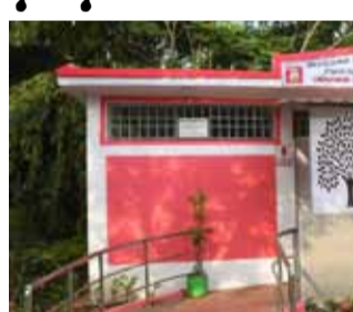
கூடுதல் மேற்படுத்தல்களைக் கழிப்பறைகளை அமைக்கப்பட்டு வருகின்றன.

சென்னை, ஜூலை. 28- சென்னையில், மாநகராட்சி சார்பாக 800-க்கும் மேற்பட்ட கழிப்பறைகள் பராமரிக்கப்பட்டு வருகின்றன. இவற்றை பெரும்பாலும் வெளியூரில் இருந்து வந்து செல்வோரும், வாகன ஓட்டிகளும் பயன்படுத்தி வருகின்றனர்.