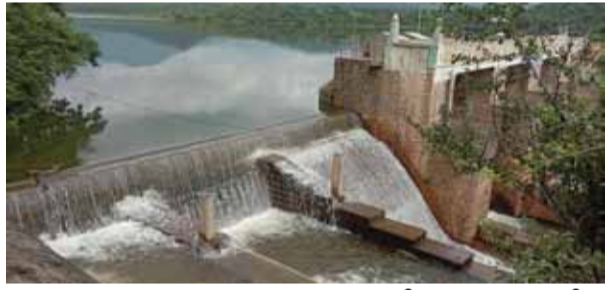
▶ பாலமேடு அருகே உள்ள சாத்தியார் அணையில் தொடர் மழை காரணமாக அணை முழுவதும் நிரம்பி மறுகால் பாய்வதை காணலாம்.