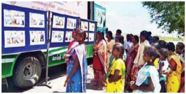
▶ விருதுநகர் மாவட்டம் காரியப்பட்டி ஊராட்சி ஒன்றியம், கல்லூப்படி ஊராட்சியில் செய்தி மக்கள் தொடர்புத் துறையில் சார்பில் வைக்கப்பட்ட தமிழக அரசின் சாதனை விளக்க புகைப்படக் கண்காட்சியினை பொதுமக்கள் பார்வையிட்டனர்.