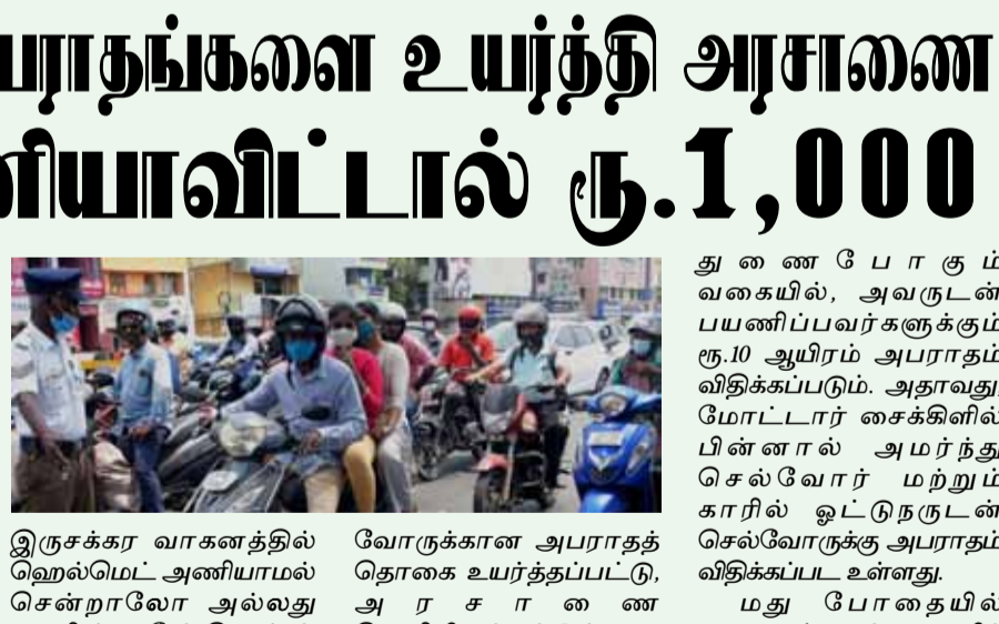
இருசக்கர வாகனத்தில் ஹெல்மெட் அணியாமல் சென்றாலோ அல்லது காரில் சீட்டெல்ல அணியாமல் சென்றாலோ ரூ.1,000, பைக் ரேஸில் ஈடுபட்டால் ரூ.5,000, அடுத்த ஒவ்வொரு முறையும் ரூ.10,000 அபராதம் வசூலிக்க வழிவகை செய்யப்பட்டுள்ளது. இதைப்போல, 46 சட்டப் பிரிவுகளின் கீழ், விதிகளை மீற வேலாருக்கான அபராதம் உயர்த்தப்படுகிறது. இவ்வாறு அரசாணையில் தெரிவிக்கப்பட்டுள்ளது. இதுகுறித்து சென்னை மாநகர காவல் ஆணையர் சங்கர்ஜிவால் கூறும்போது, "சாலை விதிகளை மீறு

துணை போகும் வகையில், அவருடன் பயணிப்பவர்களுக்கும் ரூ.10 ஆயிரம் அபராதம் விதிக்கப்படும். அதாவது, கோடார் சைக்கிளில் பின்னாலும் அமர்ந்து செல்வோர் மற்றும் காரில் ஓட்டுநருடன் செல்வோருக்கு அபராதம் விதிக்கப்படும். மது போதையில் வாகனம் ஓட்டி உயிரிழப்பை ஏற்படுத்தினால், மின்னணுக் கருவிகளில், அது தொடர்பான மாற்றங்களை செய்ய வேண்டுகிறது. எனவே, வரும் 28-ம் தேதி முதல் புதிய அபராதத் தொகை வசூலிக்கப்படும். மது அருந்திவிட்டு வாகனம் ஓட்டுபவர்களுக்கு ஏற்கனவே ரூ.10 ஆயிரம் அபராதம் விதிக்கப்பட்டு வருகிறது. இனி, மதுபோதையில் வாகனம் (கார் மற்றும் இருசக்கர வாகனம்) ஓட்டுவது தெரிந்தும், உரிய நடவடிக்கை எடுக்கப்படும்" என்றார்.