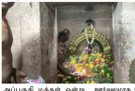
அப்பகுதி மக்கள் ஒன்று திரண்டு பூக்களை தலையில் சுமந்துவாறு ஊர்வலமாக கோவிலுக்கு சென்று அம்மனுக்கு பூக்களை காணிக்கையாக செலுத்தினர். ஒவ்வொரு பகுதி மக்களும் தங்கள் கரை வாரியாக வெடி வாணவேடிக்கைகளை வெடித்தவாரே, மேளதாளங்களுடன் ஊர்வலமாக சென்ற காட்சி காண்போரை பரவசமூட்டும் வகையில் இருந்தது. வரும் குடியிருந்து காப்புக்கட்டுவோடு தொடங்கும் திருவிழா, தேரோட்டம், மஞ்சள் விளையாட்டு என இரண்டு வாரங்களுக்கு நடைபெறும் வகையிலும் கீரமங்கலம் பேரூராட்சி முழுவதும் திருவிழா கோலம் காணத்தொடங்கியுள்ளது.

ஆலங்குடி ஜூலை.12- புதுக்கோட்டை மாவட்டம், ஆலங்குடி அருகே உள்ள கீரமங்கலம் முத்து மாரியம்மன் கோவில் திருவிழாவை முன்னிட்டு அம்மனுக்கு பூச்சொரிதல் விழா உற்சாகமாக நடைபெற்றது. தலையில் பூ தட்டுக்களை சுமந்து சென்ற நூற்றுக்கணக்கான பெண்கள் அம்மனுக்கு பூக்களை காணிக்கையாக்கி வழிபாடு செய்தனர். கீரமங்கலம் முத்துமாரியம்மன் கோவில் திருவிழா வரும் குடியிரு அன்று காப்புக்கட்டுவோடு தொடங்க உள்ளது. இதன் முன்னோட்டமாக அம்மனுக்கு பூச்சொரிதல் விழா நடைபெற்றது. ஊரின் பல்வேறு பகுதிகளில் இருந்து,