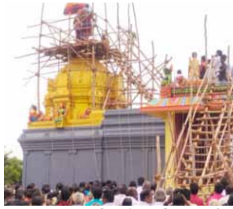
ஆவுடையர்கோவில் ஒன்றியத்துக்கு உட்பட்ட தச்சமல்லி கிராமத்தில் ஸ்ரீ முத்துமாரியம்மன் ஆலய கும்பாபிஷேக விழாவிற்காக கடந்த மூன்று நாட்களாக யாக சாலை வளர்க்கப்பட்டு புனித சிவாச்சாரியார் தலையில் சுமந்து கோவிலை வலம் வந்து கோபுர கலசத்திற்கு கும்பாபிஷேகம் செய்யப்பட்டது. நிகழ்ச்சியில் சுற்று வட்டார கிராம மக்கள் கலந்து கொண்டு சாமி தரிசனம் செய்தனர்.

ஆவுடையர்கோவில் ஜூலை.12- புதுக்கோட்டை மாவட்டம் ஆவுடையர்கோவில் அருகே தச்சமல்லி கிராமத்தில் உள்ள ஸ்ரீ முத்துமாரியம்மன், ஸ்ரீ விநாயகமூர்த்தி, ஸ்ரீ கருப்பர் சுவாமி மற்றும் பரிவார தெய்வங்களுக்கு ஆலய கும்பாபிஷேக விழா நடைபெற்றது. இதில் ஏராளமான பக்தர்கள் கலந்து கொண்டு சாமி தரிசனம் செய்தனர். பக்தர்கள் சுவாமி தரிசனம் செய்த பின்னர் சிறப்பு அன்னதானமும் நடைபெற்றது. பக்தர்கள் அனைவரும் அன்னதானத்தில் கலந்து கொண்டு சென்றனர்.