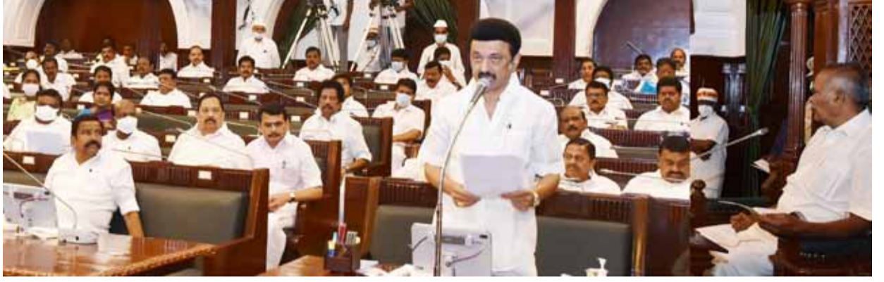
தமிழ்நாடு முதலமைச்சர் மு.க.ஸ்டாலினால் நேற்று சட்டப்பேரவையில், தஞ்சாவூர் மாவட்டம், களிமேடு கிராமத்தில் நேற்று அதிகாலை தேர் மின் கம்பியில் உரசியதால் ஏற்பட்ட விபத்தில் உயிரிழந்தவர்களுக்கு மரியாதை செலுத்தும் வகையில் இரங்கல் தீர்மானம் நிறைவேற்றப்பட்டு மௌன அஞ்சலி செலுத்தப்பட்டது.

இதையடுத்து அதிமுகவை சட்டப்பேரவையில் வெளியேற்ற சபாநாயகர் உத்தரவிட்டதை தொடர்ந்து வெளியில் லா தகருத்தை சபையில் பதிவு செய்துள்ளார். திமுக துணைத் தலைவரின் செல்வபெருந்தகை தேவையில்லாத கருத்தை சபையில் பதிவு செய்துள்ளார். திமுக துணைத் தலைவரின் செல்வபெருந்தகை தொடர்ந்து பேசிய வருவதாக சந்தேகம் வரக்கூடாது. முன்னாள் முதல்வர் பெயரை வேண்டுமென்றே செல்வபெருந்தகை கூறி வருகிறார். சட்டசபையில் இத்தகைய முன்பு என்னென்ன சம்பவம் நடந்தது என்பதெல்லாம் மக்களுக்கு தெரியும். இப்போது நாங்கள் மக்கள் பிரச்சனையை கொண்டு வந்து பேசுகிறோம். சபாநாயகர் நடுநிலை இல்லாமல் செயல்படுவது வருத்தம் அளிக்கிறது என்றார்.